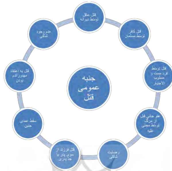
نمودار شماره ۲: موارد جنبه عمومی در جنایات در قانون مجازات اسلامی