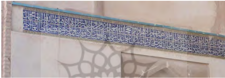
تصویر ۶: صفة مسجد نقشینه بیدگل