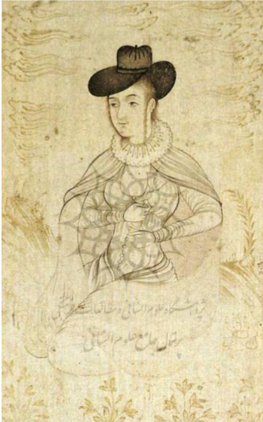
تصویر ۱۱: «زنی در جامه اروپایی»، محمد طاهر، ۱۰۸۰ق/ ۱۶۷۰م، اندازه طراحی: ۱۲/۷×۸/۱ سم.

محل نگهداری: نامعلوم (Sotheby's, 1999: lot. 51)