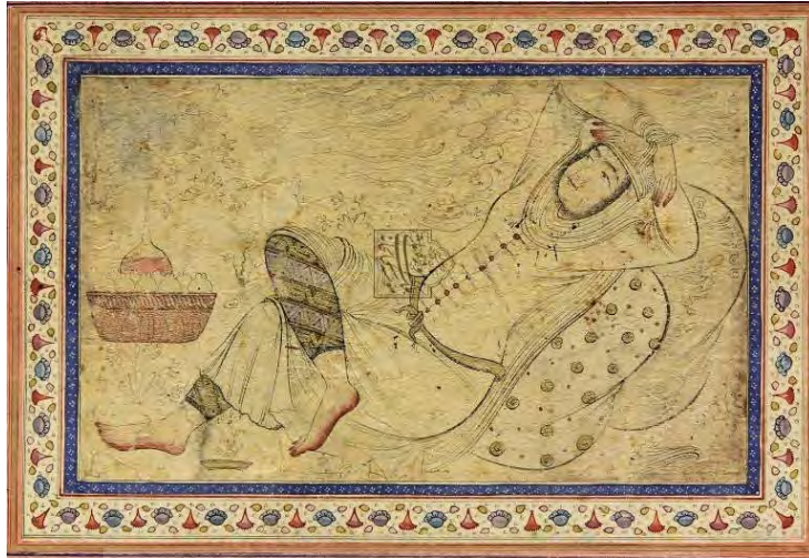
تصویر ۱۰: «زن لمیده»، محمد طاهر نقاش، نیمه دوم سده یازدهم / هفدهم، برگه از یک مرقع، اندازه کاغذ: ۳۰×۱۹/۵ سم، کتابخانه و موزه ملی ملک (شماره: ۱۳۹۳/۰۴/۰۶۰۲۹/۲۰۰)

دومین اثر مرقوم «محمد طاهر» که تاریخ ۱۰۸۰ق / ۱۶۷۰م دارد، زنی در جامه اروپایی است (تصویر ۱۱). او با کلاهی لبه‌دار در فضای باز بر زمین نشسته و جامی در دست دارد. پس‌زمینه بی‌رنگ با ابرها، سنگ‌ها و گل‌بوته‌هایی به رنگ طلایی تزیین شده است. این اثر در سال ۱۹۹۹ در حراجی ساتبی لندن عرضه شد (Sotheby's, 1999: lot. 51) و محل کنونی نگهداری آن نامعلوم است. سومین اثری که امضای «محمد طاهر» دارد، درویش نشسته‌ای را نشان می‌دهد که با دست راست خود بر زمین تکیه کرده است. او سر طاس و برهنه خود را به سمت چپ تصویر خم کرده و در مقابل صخره‌ای بزرگ نشسته است. این طراحی یک جدول نقره‌ای و حاشیه‌ای از اسلیمی‌های گل‌دار دارد، و در اصل، به برگه‌ای از یک مرقع چسبانده شده بوده است. لکه‌های رنگ بر این طراحی رنگ‌پریده پاشیده شده و در قسمت بالایی اش اثرات احتمالی کتیبه‌ای وجود دارد که پاک شده است (Swietochowski and Babaie, 1989: 82; Robinson and et al., 1976: 204). امضای «محمد طاهر» در گوشه پایین سمت چپ به چشم می‌خورد. بازیل رایبسون او را هنرمندی ناشناخته معرفی کرده که در فهرست نقاشان ایوان اسچوکین ۱۶ هم نیامده است (همان‌جا). به هر حال، این سه طراحی از نظر سبکی به‌شدت به آثار رضا عباسی و دامادش، معین مصور، که هر دو کاشانی بودند، وفادار است. همین‌طور به‌عنوان آخرین ویژگی بارز این طراحی‌ها باید گفت که خطوط در آن‌ها کیفیت خوش‌نویسانه دارد.