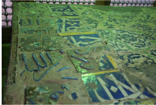
تصویر ۴: روی صندوق مزار بقعة حبيب بن موسى در کاشان

هر قطعه از کاشی‌های خوش‌نویسی‌شده توسط طاهر، یا در بالا و یا در پایین نوار باریک زردرنگی دارد که در حکم حاشیه‌ای برای آنهاست. بنابراین مشخص می‌شود که متعلق به کتیبه‌ای بوده‌اند که ارتفاع آن به اندازه دو کاشی بوده است. بر یکی از این کاشی‌ها عبارت «سنه ۱۰۷۰» و بر دیگری عبارت «کتبه طاهر نقاش» دیده می‌شود. کلمه «کتبه» نشان می‌دهد که طاهر تنها کتابت آن را انجام داده و در ساخت کاشی دخالتی نداشته که اگر چنین می‌بود، باید از کلمه‌ای مانند «عمل» استفاده می‌کرد. اگر کاشی‌های حاوی تاریخ و امضای طاهر در روی هم قرار گیرند، عبارات پایانی سوره انسان را نشان می‌دهند: «وَالظَّالِمِينَ أَعَدَّ لَهُمْ عَذَابًا أَلِيمًا» (تصویر ۳). در این دو کاشی این حروف مشهود است: «سین هم عذ با الیما و؟» از طرف دیگر، یکی از کاشی‌های بالاترین ردیف، بخشی از آیه دوم این سوره («خَلَقْنَا [ا] الْإِنْسَانَ [ن] مـ[ن]») را نشان می‌دهد. به همین دلیل باید گفت که این کتیبه حاوی تمام آیات سوره انسان بوده است.