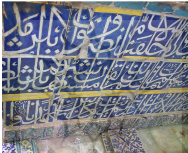
تصویر ۲: صندوق مزار بقعه حبیب بن موسی در کاشان

Watson, 1985: 136-138) و اکنون جای آن با کاشی‌های هفت‌رنگ دوره صفوی پر شده است. این کاشی‌ها عموماً نقوش گیاهی دارند و به‌صورت نامنظم و فقط به‌عنوان پوشش روی صندوق را فرش کرده‌اند. در جداره‌های چهار طرف، کتیبه‌هایی از کاشی زرین‌فام حاوی آیات قرآن در دو ردیف (یکی در پایین و دیگری در بالا) وجود دارد که کتیبه پایینی حفظ شده ولی بخشی از کتیبه بالایی در جهت شمالی از بین رفته است. ۹ سه جانب صندوق با کاشی‌های زرین‌فام ستاره‌ای شش‌پر و شش‌ضلعی و یا هشت‌پر و چلیپایی پوشیده شده است. بخش عمده‌ای از جداره جهت شمالی صندوق با کاشی‌هایی پوشانده شده که مورد نظر ما و کار شده توسط طاهر نقاش است. البته چند قطعه از کاشی‌های طاهر روی صندوق هم وجود دارد (تصویر ۴).