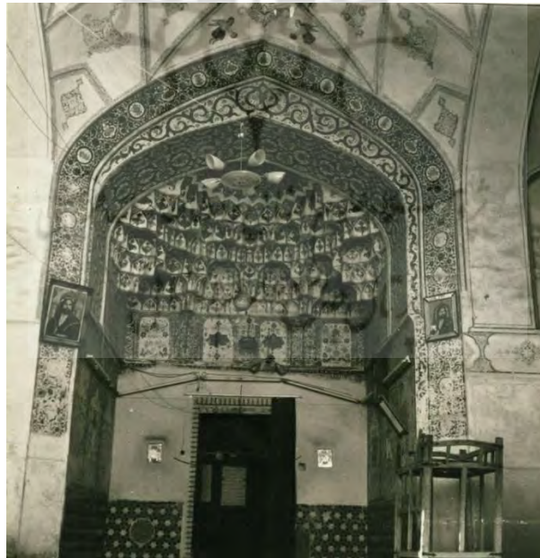
تصویر ۹: ایوان ورودی بقعه سلطان عطابخش قبل از مرمت (پرونده ثبتی اثر)

محمد طاهر نقاش کاشانی: شاعر ذوفنون دوره صفوی