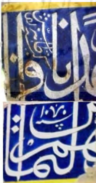
تصویر ۳: تصویر بازسازی شده از روی هم قرار گرفتن دو کاشی حاوی تاریخ و امضای طاهر نقاش