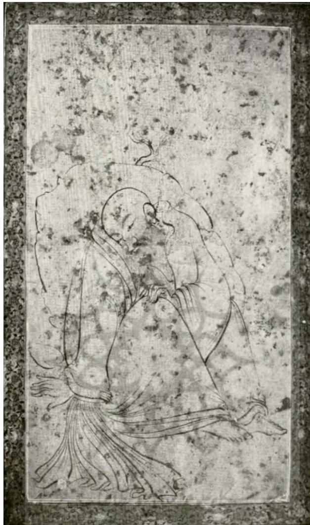
تصویر ۱۲: «درویش نشسته»، محمد طاهر، نیمه دوم سده یازدهم/هفدهم، اندازه کاغذ: ۲۸×۱۷/۵ سم،

اندازه طراحی: ۱۹/۵×۱۱ سم، مجموعه کی بر (Robinson and et al., 1976: pl. 82)