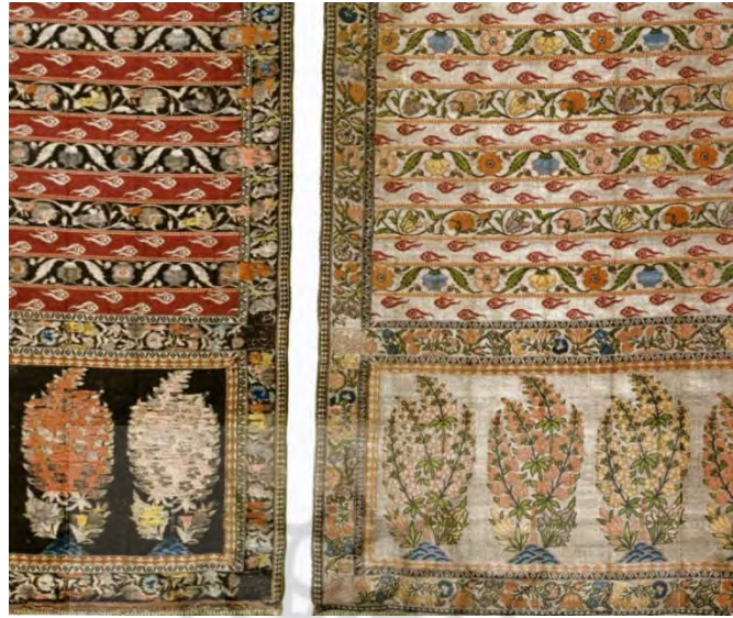
تصویر ۸: پشت و روی یک پارچه ابریشم زربفت، کاشان، اواخر سده یازدهم/ هفدهم و اوایل سده دوازدهم/ هجدهم، موزه ملی کراکوف ۱۴ (شماره دسترسی: XIX-2510)، (Biedrońska-Słota, 2010: fig 3)

در کاشان می‌توان نوع طرح‌هایی را که طاهر برای بافندگان تهیه می‌کرده است، تصور کرد (تصویر ۸).