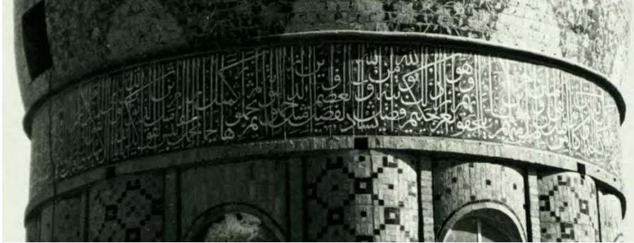
تصویر ۵: گنبد پیشین بقعه حبیب بن موسی در کاشان (پرونده ثبتی اثر)