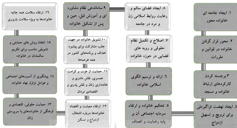
شکل ۲. توجه به ابعاد کمی (رنگ روشن) و کیفی (رنگ تیره) جمعیت در سیاست های کلی خانواده