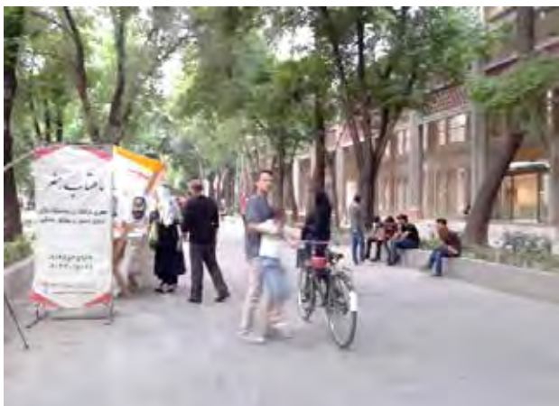
تصویر ۴. نمایی از پیاده‌راه چهارباغ در زمان حضور خرده‌فروشی‌های موقت. عکس: مینا کشانی همدانی، ۱۳۹۸.