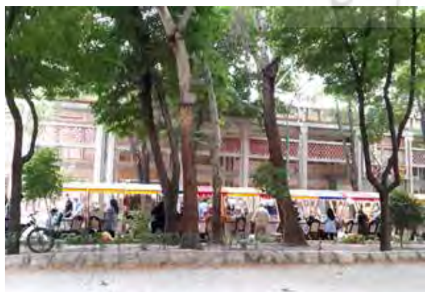
تصویر ۳. نمای پشتی غرفه‌های خرده‌فروشی موقت در چهارباغ، جبهه ساختمان‌هایی که در تصویر مشاهده می‌شود مربوط به مجموعه هشت بهشت است که در حال حاضر غیرفعال هستند. عکس: مینا کشانی همدانی، ۱۳۹۸.

خرده‌فروشی در میانه چهارباغ، اشاره کرد (تصاویر ۳، ۴ و ۵). این بازارچه شامل ۹۰ غرفه صنایع دستی و سایر محصولات روزمره و سه ون-کافه ۵ است.