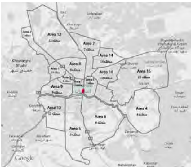
تصویر ۱. موقعیت خیابان چهارباغ در شهر اصفهان. مأخذ: www.iranrealestateboard.com .