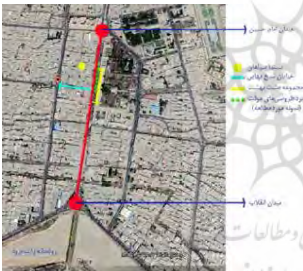
تصویر ۲. موقعیت خیابان چهارباغ بازارچه مورد مطالعه.

در حال حاضر این خیابان به‌عنوان یک پیاده‌راه دائم در قلب شهر اصفهان، فضای متفاوتی را به نمایش گذاشته است. همچنین به‌واسطه سایر تغییرات کالبدی، کیفیت محیطی این خیابان دچار دگرگونی‌هایی شده و با توجه به قطع عبور و مرور سواره، حضور اجتماعی افراد در آن، شکل متفاوتی به خود گرفته است که به‌ویژه سرزندگی و پویایی آن دستخوش تغییراتی شده است. در این میان و به‌منظور افزایش سرزندگی و رونق خیابان مذکور، مدیریت شهری تصمیم به انجام اقداماتی مبنی بر اصلاح شرایط موجود گرفت که از آن جمله می‌توان به برگزاری رویدادهای مناسبی و مقطعی و اجازه ورود و برپایی بازارچه‌های موقت