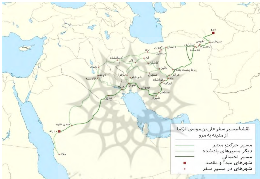
شکل ۴. مسیرهای احتمالی هجرت امام رضا (ع) از مدینه تا مرو (نقل از: https://fa.wikipedia.org/ ).