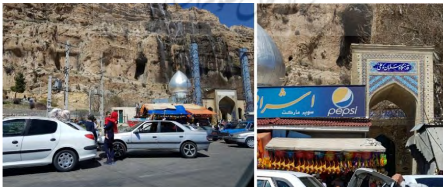
شکل ۵. نمونه‌ای از قدمگاه‌ها در ایران: قدمگاه سلمان و علی در میانه راه شیراز به کازرون که در کنار آبشار دشت ارژن بنا شده است.