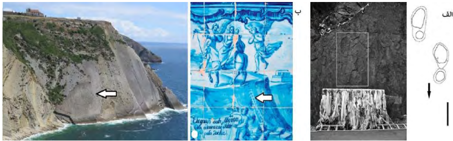
شکل ۳. فسیل ردپای دایناسورها که مقدس پنداشته شده‌اند: الف. ردپای دایناسور سورپود که در اثر فرسایش شبیه ردپای انسان شده است. پیکان جهت حرکت جانور را نشان می‌دهد و رد جلو اثر دست، رد بزرگ‌تر اثر پای دایناسور است. بوداییان تبت آن را مقدس می‌دانند و آن را جای پای خدایان یا پادشاهان اسطوره‌ای می‌پندارند (Xing et al, 2011)؛ ب. ردپای دایناسور ژوراسیک در دامنه ساحلی (پیکان) که آن را به ردپای قاطر حضرت مریم (ع) نسبت داده و در کاشی‌کاری کلیسایی در پرتغال نمایش داده‌اند (پیکان) (Lockley et al, 1994).