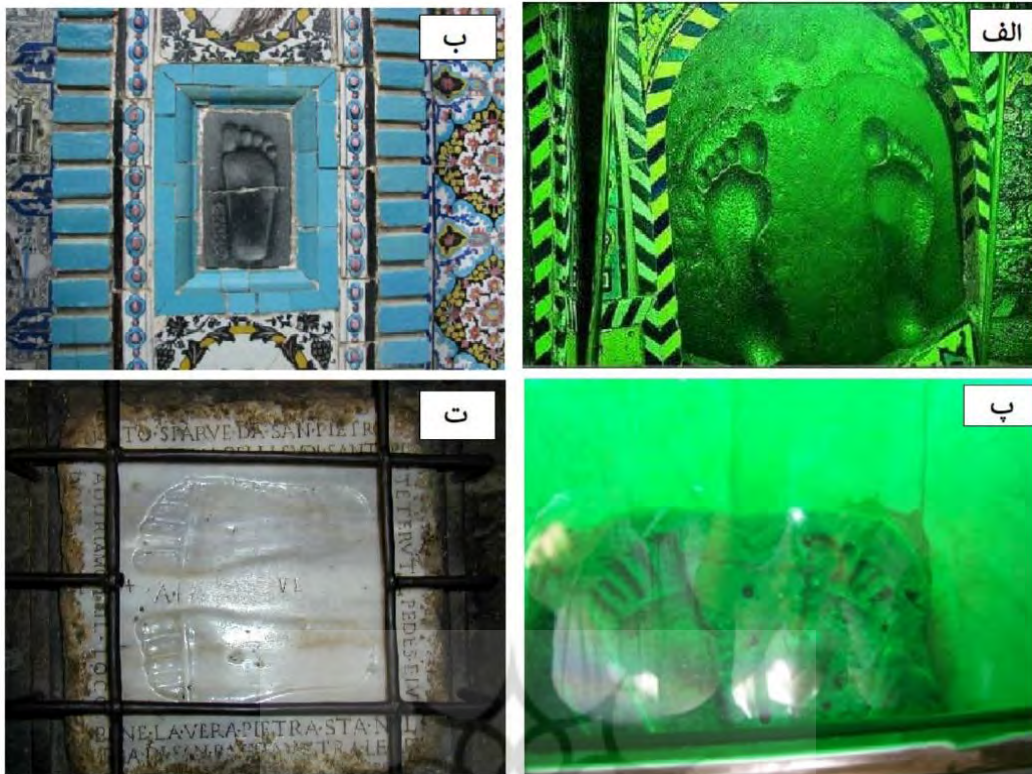
شکل ۱. نمونه‌هایی از ردپاهای مقدس: الف جای پای امام‌رضا (ع) در قدمگاه نیشاپور؛ ب. جای پای امام‌رضا (ع) در تکیه معاون‌الملک کرمانشاه؛ ج. جای پای شیخ‌الاحمد‌البدای، طنطا در مصر؛ د. جای پای حضرت مسیح (ع) کلیسای Domine Quo Vadis رم (تصاویر بدون مقیاس‌اند و از منبع اینترنتی www.google.com جمع‌آوری شده‌اند.