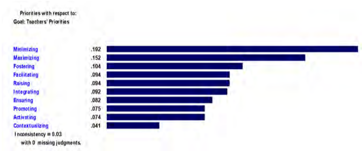
شکل (۲). نمودار وزنی ده عامل اصلی انتخاب پسامتد در مدارس دولتی

میانگین و عناصر افزایش آگاهی فرهنگی با وزن نسبی ۰/۰۹۴، عامل تسهیل تعامل با وزن نسبی ۰/۰۹۴، عامل اطمینان ارتباط اجتماعی با وزن نسبی ۰/۰۹۲، عامل ارتقای خودجوش فراگیر با وزن نسبی ۰/۰۸۲، عامل یکپارچگی مهارت‌ها با وزن نسبی ۰/۰۷۵، عامل فعال کردن استعداد زبانی با وزن نسبی ۰/۰۷۴، به‌ترتیب در رتبه‌های چهارم تا نهم جای گرفتند. در پایان، متنی کردن داده‌های زبانشناسی با وزن نسبی ۰/۰۴۱ از اهمیت بسیار کمتری در نزد معلمان مدارس دولتی برخوردار بوده بطوری که در انتهای نمودار آمار و داده‌ها و در رتبه دهم قرار گرفت. و این بدین معناست که متنی کردن داده‌های زبانشناسی تأثیر زیادی در آموزش به‌روش پسامتد نداشت. سرانجام، نرخ ناسازگاری ماتریس مورد نظر برابر (IR=0.03) است و چون این مقدار کمتر از ۰/۱ است (IR≤0.1) بنابراین در مقایسات زوجی ماتریس مورد نظر، سازگاری دارد.