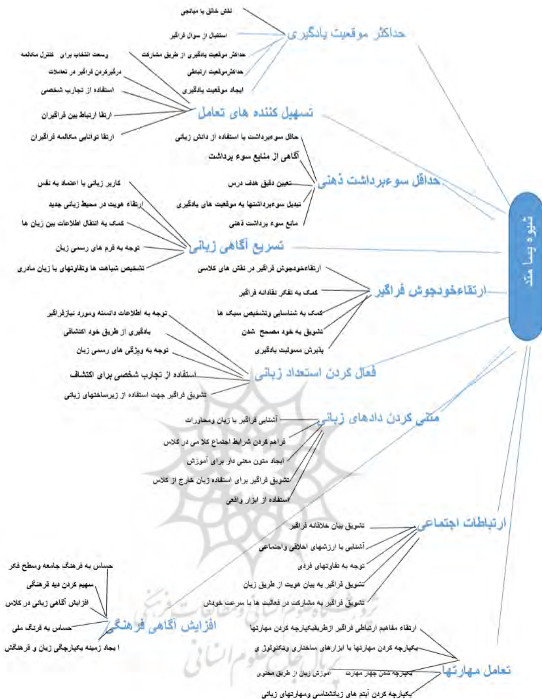
شکل (۱). نمودار درختی سلسله مراتبی AHP عوامل موثر بر پسامتد