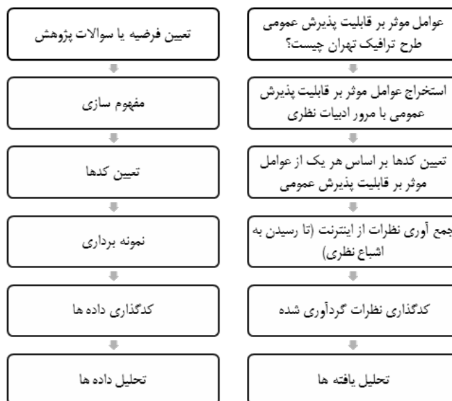
نمودار شماره ۱: مراحل فرایند پژوهش