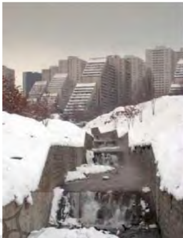
تصویر ۱. تراس‌بندی و کانال‌کشی رودخانه در که.

اتصالات، نقاط تماس بین مؤلفه‌ها را افزایش می‌دهند که این خود موجب انسجام و افزایش تاب‌آوری خواهد شد (قرایی و همکاران، ۱۳۹۶). در این طرح و برنامه‌ریزی، شاخص ارتباط یا اتصال در سه سطح: (۱) پیوستگی مؤلفه‌های طراحی، (۲) تقویت ارتباط فضایی و (۳) ریزدانه‌گی و نفوذپذیری بررسی می‌شوند. در راستای استفاده از ساختار شاخص ارتباط و اتصال، می‌توان به پیوستگی محورهای ارتباطی اشاره کرد که موجب افزایش سطح دسترسی در زمان کوتاه‌تر خواهد شد؛ همچنین موجب در دسترس بودن و افزایش اتصال داخلی در سیستم خواهد شد. علاوه بر آن نفوذپذیری از دیگر متغیرهای طراحی این