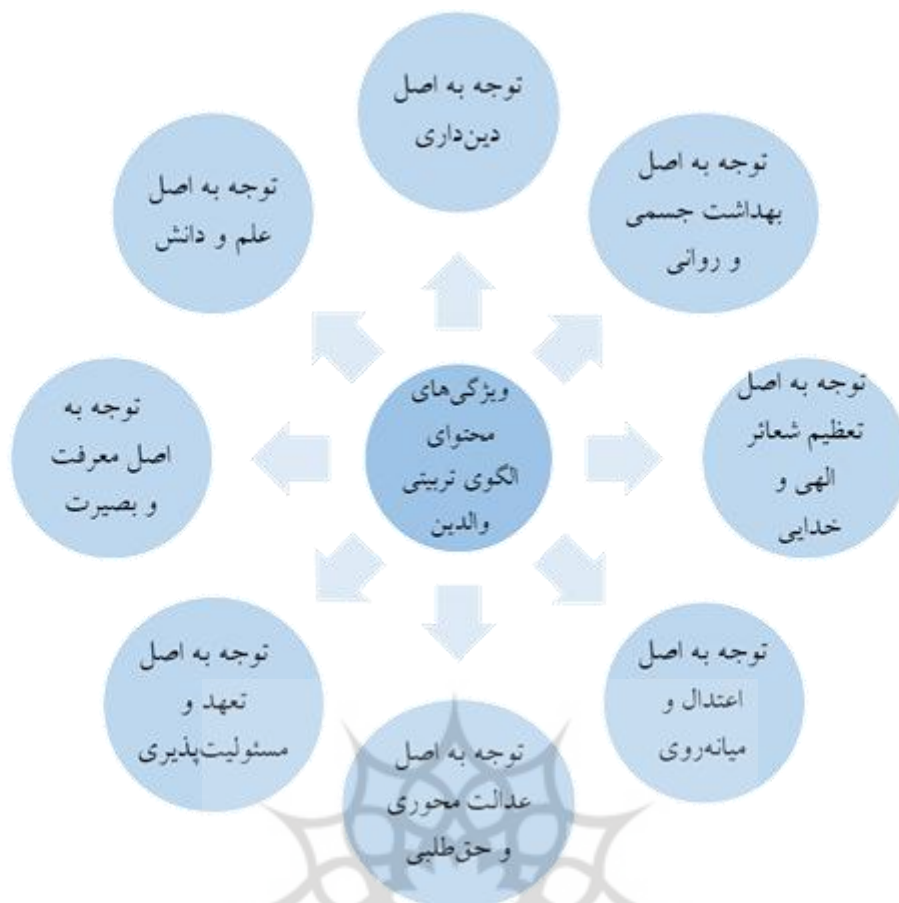
شکل ۱. ویژگی‌های محتوای الگوی تربیتی والدین مبتنی بر سبک زندگی اسلامی