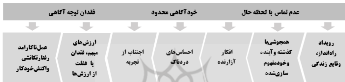
شکل ۱. پیشنهاد الگوی مفهومی فرآیند آسیب‌شناسی ACT

شیوه درمان گروهی یوسفی و همکاران (۳۰)، عیسی نژاد و آزادبخت (۳۱)، صدقی و همکاران (۳۲) نشان دادند که این رویکردها به شیوه گروهی اثربخش بوده و در مقایسه آن‌ها تفاوت معناداری وجود نداشت و پژوهش‌های بی‌شماری از عدم معناداری تفاوت بین دو رویکرد درمانی به شیوه گروهی حمایت کرده‌اند؛ بنابراین درمان و مشاوره به شیوه گروهی به‌عنوان بخشی انکارناپذیر از متغیر مستقل، اثربخش است. هرچند که این بحث به‌عنوان توجه بر اثربخشی گروه کمتر موردتوجه واقع شده و احتمالاً به مطالعات تجربی متمرکزتری نیاز دارد که به‌عنوان پیشنهاد پژوهشی مطرح است.