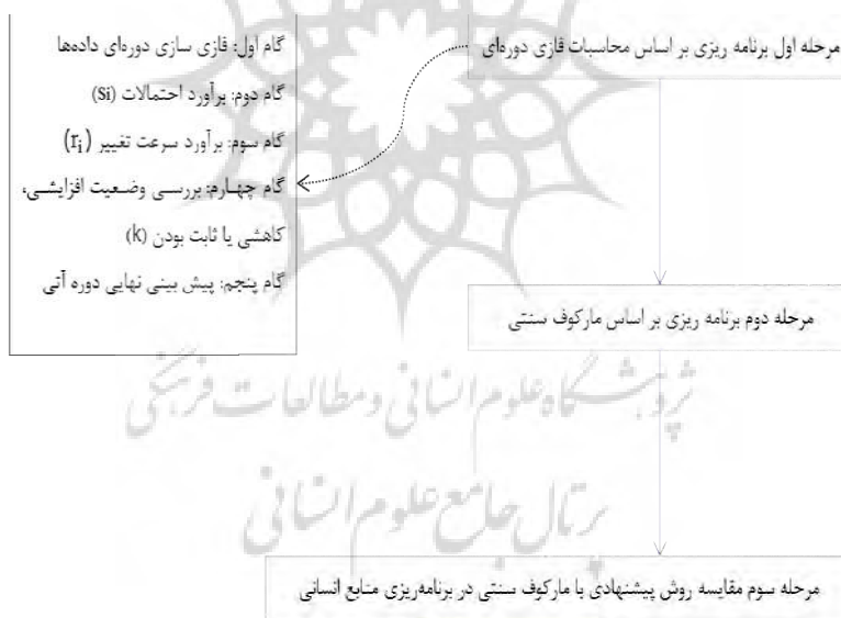
شکل ۱. فرایند ارائه روش پیشنهادی و کاربرد آن در مقایسه با مدل سنتی

این پژوهش از نظر گردآوری داده به صورت کتابخانه‌ای است داده‌های پژوهش از طریق مطالعه و بررسی اسناد و مدارک شرکت نادکو به دست آمده‌اند، و پس از ارائه الگو به کاربرد تکنیک در مورد مطالعه اقدام می‌شود و مدل از نوع تحقیقات کمی محسوب می‌شود و از نظر هدف توصیفی است و چون در مقطعی از زمان انجام می‌گیرد از نظر زمانی نیز مقطعی است. در این پژوهش اطلاعات شرکت نادکو مورد بررسی قرار می‌گیرد. فرایند کلی پژوهش در شکل ۱ نشان داده شده است.