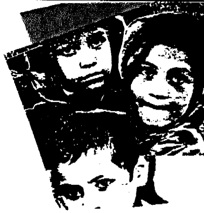
قیبه از صفحه ۱۵۵

نگوهای مختلف باشد. مثلاً پدر و مادر ر خانواده اهداف ارزشی ویژه ای را دنبال می کنند ولی معلمان مدرسه و یا نگوهای اجتماعی دیگر اهداف ارزشی دیگری را متضاد با خانواده دنبال می کنند و... زمانی نیز ممکنست تعارض در خود یک فرد واقع شود، که در اینجا تعارض بین حرف و عمل خود صورت می گیرد. معلم در کلاس دانش آموزان را دعوت به همکاری و صداقت می کند ولی خود در عمل با معلمان دیگر و یا دانش آموزان این خصوصیات را رعایت نمی کند. پدر و مادر فرزند را از دروغگویی منع می کنند ولی خود در عمل به این کار مبادرت می ورزند.