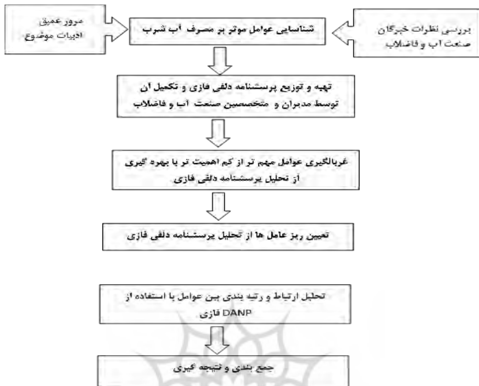
شکل شماره (۱): مراحل پژوهش

در این روش، ابتدا جمع آوری نظرهای گروه تصمیم گیرنده و تخصیص عدد فازی مثلثی به نظر خبره، با توجه به واژه زبانی انتخاب شده توسط خبره به معیار مورد نظر انجام می گیرد. سپس برای محاسبه میانگین نظرات n پاسخ دهنده، میانگین فازی آن ها محاسبه شود. تایید و غربالگری شاخص ها که این کار از طریق مقایسه مقدار ارزش اکتسابی هر شاخص با مقدار آستانه S صورت می پذیرد. مقدار آستانه با استنباط ذهنی تصمیم گیرنده معین می شود و مستقیم بر روی تعداد عواملی که غربال می شوند تاثیر خواهد داشت. هیچ راه ساده و قانونی برای تعیین مقدار آستانه وجود ندارد و اصولاً از نظر خبرگان استخراج می شود (Cheng & Lin, 2002).