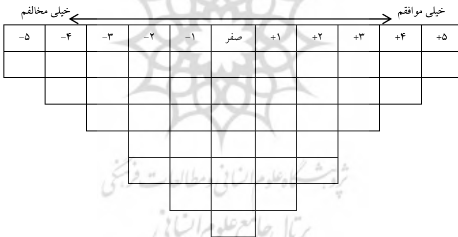
شکل (۱): نمودار فلش کیو و توزیع دسته‌بندی عبارات کیو

برای دسته‌بندی، یک نمودار کیو برای عبارت پژوهش به گونه‌ای تنظیم شد که بتواند مجموعه عبارات را در یک توزیع نرمال از خیلی موافقم (+۵) تا خیلی مخالفم (-۵) رتبه‌بندی کند و برای سهولت در پاسخ‌گویی مطابق شکل (۱) از نمودار فلش کیو استفاده شده است.