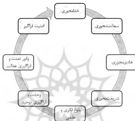
شکل ۳: شاخص‌های بنیادین جامعه مهدوی (بهروزی لک، ۱۳۹۱)

براساس منابع دینی معتبر، شاخص‌های مختلفی را برای جامعه مهدوی می‌توان در نظر گرفت که هشت مورد از این شاخص‌های بنیادین در شکل شماره ۳ ارائه شده است (بهروزی لک، ۱۳۹۱).