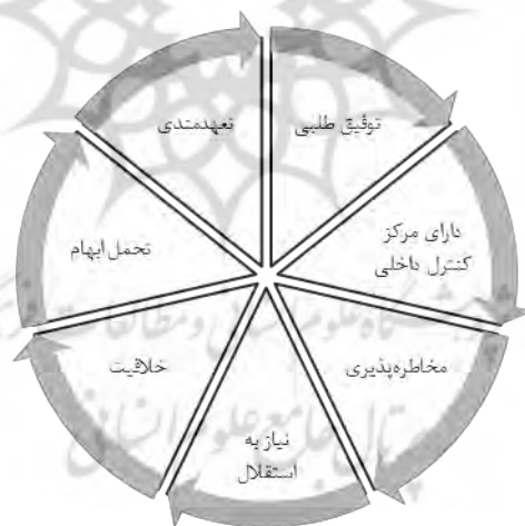
شکل ۲: ویژگی های مشترک کارآفرینان (احمدپور داریانی، ۱۳۹۱: ۸۱-۸۹)