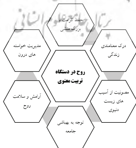
شکل ۱. روح در دستگاه تربیت معنوی

– مدیریت خواسته‌های درون: پرواضح است که بدون این خصیصه، هیچ‌گاه نمی‌توان به آرامش برخاسته از قرب الی الله دست یافت. تربیت معنوی، هوس‌ها و غرایز را به‌منظور پیشبرد اهداف انسانی در اختیار شخص فراگیر قرار می‌دهد (میرعرب، ۱۳۹۲، ص ۲۶۷-۲۴۴).