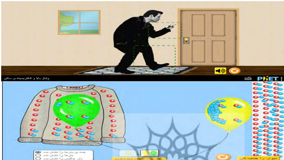
شکل ۱. محیط شبیه‌سازی phET (مبحث الکتریسته و بارها)

ابزار پژوهش: ابزار اندازه‌گیری در پژوهش حاضر پرسشنامه‌های حل مسئله و توانایی شناختی است: