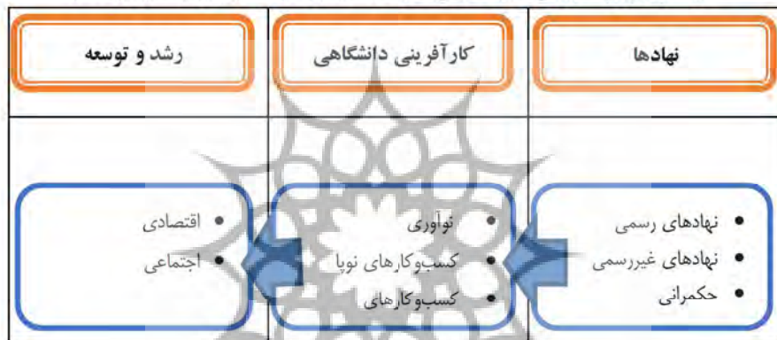
شکل ۱: چارچوب مفهومی نظریه تلفیقی نظریه نهادی نورث (۱۹۹۰) و ویلیامسون (۲۰۰۰)

نوع نگاه در کارآفرینی دانشگاهی در نظریه‌ها و مدل‌های مختلفی متفاوت است و تبیین سطوح مختلف در آن‌ها متفاوت است. در رویکرد نیاولی و فوگل ۱ (۱۹۹۴)، بیشتر بر سطح فرد و کلان تمرکز شده است. والدز (۱۹۹۸) در چارچوب زیست‌بوم کارآفرینی، بیشتر بر سطح خرد و فرد متمرکز شده است. کوهن (۲۰۰۶) در رویکرد زیست‌بوم کارآفرینانه پایدار به سطح سازمانی بیشتر توجه کرده است. در مدل ایزنبرگ (۲۰۱۱)، تمرکز مدل کارآفرینی عمدتاً بر سطح کلان است. مدل زیست‌بوم کارآفرینی اشیگل (۲۰۱۵) اغلب عوامل سطح کلان و فرد را پوشش می‌دهد. بنابراین، با عنایت به اهداف و سؤالات پژوهش حاضر، یافته‌های ادبیات و یافته‌های میدانی پژوهش که از طریق مصاحبه به دست آمده است، در هم تنیدگی کارآفرینی دانشگاهی در سطح مختلف و در نهایت اینکه ضرورت داشتن نگاه یکپارچه‌ای در تبیین