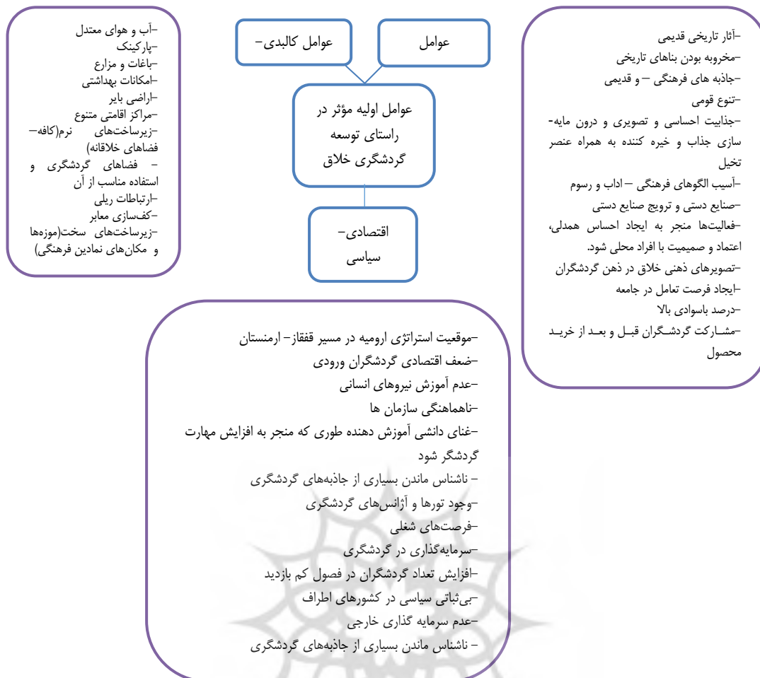
شکل ۱. مدل مفهومی عوامل اولیه مؤثر در راستای توسعه گردشگری خلاق شهر ارومیه