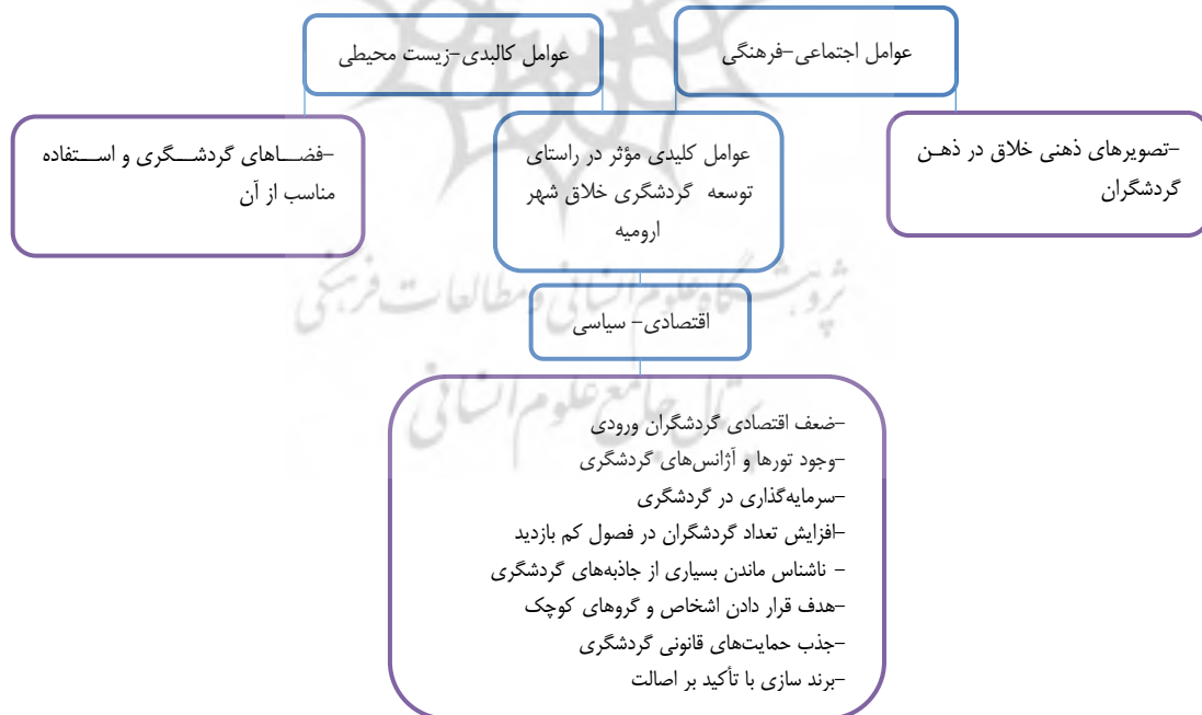
شکل ۳. مدل مفهومی عوامل کلیدی مؤثر بر روند آینده گردشگری خلاق شهر ارومیه

برای شناسایی عوامل اولیه مؤثر در گردشگری خلاق شهر ارومیه از نظر کارشناسان استفاده شد و با بررسی نظر کارشناسان در مجموع ۴۰ عامل استخراج شدند. در ادامه به تحلیل کلی محیط سیستم پرداخته شد و میزان تأثیرگذاری مستقیم و غیرمستقیم این عوامل بر یکدیگر و بر روند آینده گردشگری خلاق شهر ارومیه مشخص شد. در نهایت از مجموع ۴۰ عامل اولیه تأثیرگذار، ۱۰ عامل به‌عنوان پیشران‌های کلیدی مؤثر بر روند آینده سیستم انتخاب شدند که همه این پیشران‌های کلیدی در هر دو روش تأثیرگذاری مستقیم و غیرمستقیم تکرار شده‌اند. پیشران‌های کلیدی تأثیرگذار از میان ۴۰ عامل مورد بررسی در روش مستقیم و غیرمستقیم به شرح زیر هستند: