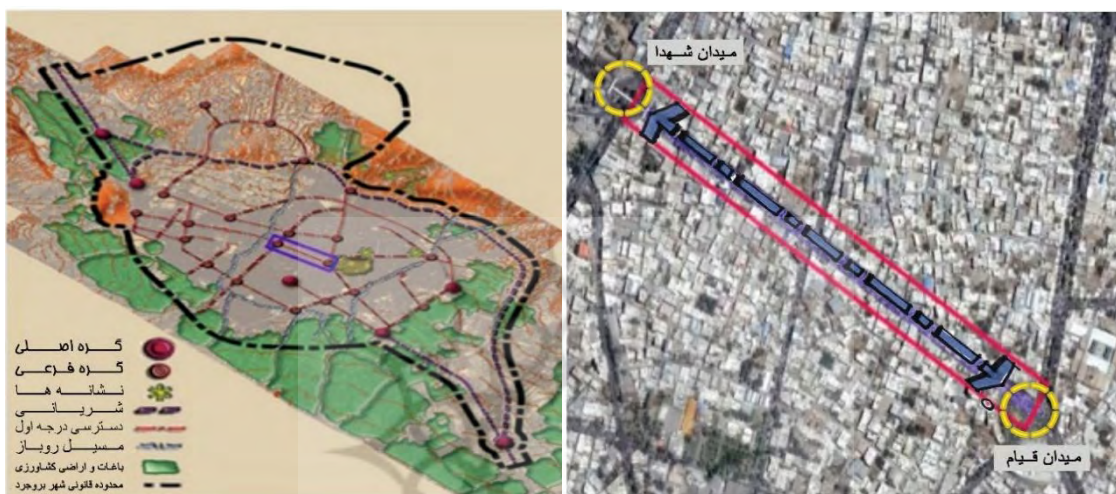
شکل ۲. موقعیت محدوده مورد مطالعه در شهر بروجرد

شهر بروجرد، از نظر تقسیمات سیاسی متعلق به استان لرستان در غرب کشور است. وسعت محدوده قانونی شهر بالغ بر ۳۷۱۹ هکتار بوده که به سه منطقه شهرداری و ۱۷ ناحیه که شامل ۳۶ محله می‌باشد تقسیم شده است. بر اساس سرشماری سال ۱۳۹۵ شهر بروجرد دارای ۳۲۶۴۵۲ نفر جمعیت، ۱۰۲۲۵۸ خانوار و بعد خانوار ۳،۱۹ می‌باشد. محدوده مورد مطالعه، بلوار شهدا (حد فاصل میدان قیام تا میدان شهدا) به طول ۸۰۰ متر می‌باشد که در امتداد شمال غرب- جنوب شرق کشیده شده است. محور یاد شده از نظر تقسیمات کالبدی در محدوده منطقه یک شهر قرار دارد. شیب توپوگرافی محور از شمال به جنوب است. کارکرد اصلی آن در هماهنگی با محورهای اطراف کارکرد تجاری- گردشگری است و با توجه به دو طرفه بودن بلوار شهدا، در برقراری ارتباط و ایجاد هم‌پیوندی میان دو گره اصلی شهر یعنی میدان شهدا و میدان قیام نقش مهمی ایفاء می‌کند. شکل دو، محدوده مورد مطالعه را نمایش می‌دهد.