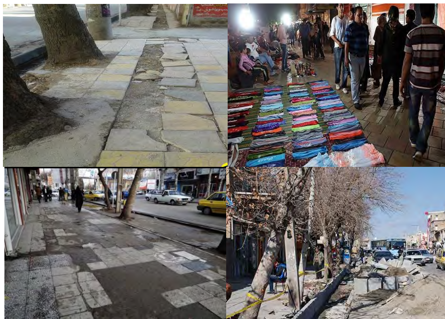
شکل ۳. برخی از مشکلات و چالش‌های موجود در مسیرهای پیاده

بر اساس نظریات مطرح در زمینه اهمیت پیاده‌روها و ضوابط مربوط به ایجاد، بهسازی و مناسب‌سازی آن‌ها و همچنین آسیب‌شناسی انجام پذیرفته توسط نگارندگان، چالش‌ها و موانع از سه جنبه (قبل از اجرا، هنگام اجرا و پس از اجرا) مورد توجه قرار گرفته است. عوامل چالش‌زا یا مؤلفه‌های تأثیرگذار بر بهسازی و مناسب‌سازی محور پیاده در ۳۱ مورد بر حسب هر یک از چالش‌های سه مرحله، تنظیم و از هم تفکیک شده‌اند که در جدول دو، نمایش داده شده است.