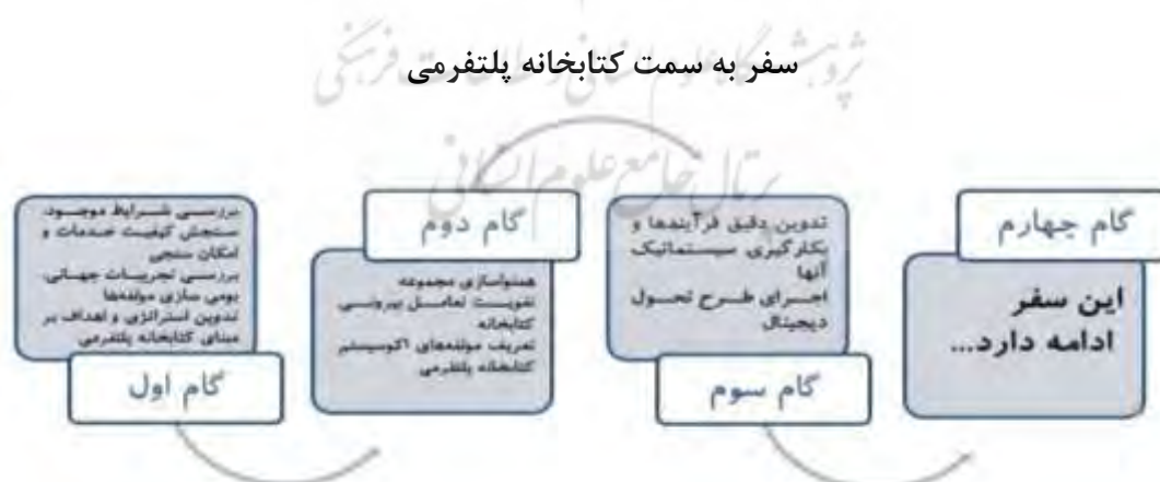
شکل ۱. گام‌های بازتعریف کتابخانه‌ها

همان‌طور که وینبرگر (۲۰۱۲) بیان داشته که کتابخانه برای کاربران به مرکزی تبدیل می‌شود که در آن بتوانند از یکدیگر بیاموزند، خلاق و مبتکر باشند، درباره کارهایشان به بحث بنشینند و دانش اجتماعی را به دست آورده و به کار ببندد، افزایش ضریب مشارکت ذی‌نفعان کتابخانه یکی از ارکان تحقق این مدل تفکر است. برای رسیدن به این بازتعریف باید گام‌هایی را تعریف و اجرا کرد.