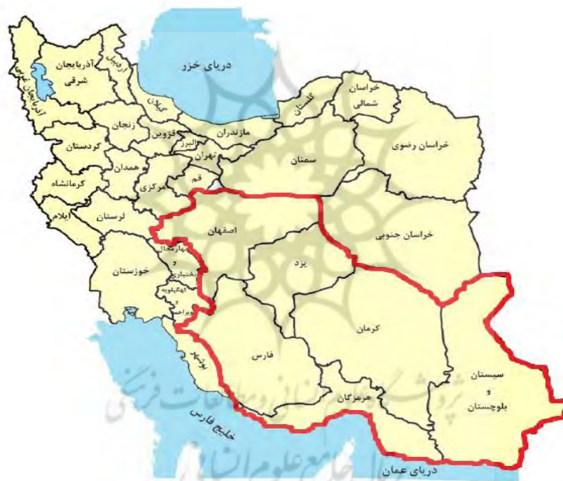
شکل ۲. محدوده مکانی تحقیق

در این پژوهش، از مدل اقتصاد سنجی فضایی برای بررسی عوامل اقتصادی موثر بر سطح زیرکشت محصولات زراعی در شش استان ایران که دارای اقلیمی خشک در بازه زمانی ۱۳۹۲-۱۳۹۷ بوده، استفاده شده است. اطلاعات مورد نیاز از درگاه ملی آمار، سالنامه‌های آماری، آمارنامه‌های کشاورزی و مرکز هواشناسی کشور دریافت شد. محدوده مکانی این پژوهش در شکل (۱) با خطوط پررنگ مشخص شده است.