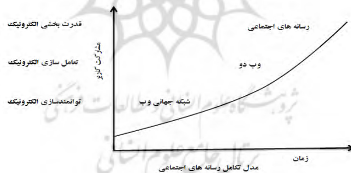
شکل ۲- نمودار تکامل رسانه‌های اجتماعی (Effing & et al, 2011: 29)

- سطح سوم استفاده از فناوری‌ها، قدرت بخشی به شهروندان است. قدرت بخشی الکترونیکی به شهروندان کمک می‌کند تا در فرایندی از پایین به بالا، تأثیرگذاری بیشتری روی برنامه‌های سیاسی دولت داشته باشند. در دیدگاه پایین به بالا، شهروندان به عنوان تولیدکنندگان در حال ظهور به جای مصرف‌کنندگان صرف سیاسی محسوب می‌شوند. در این سطح، نیاز به اجازه شهروندان برای تأثیرگذاری و مشارکت در شکل‌گیری سیاست‌ها دیده می‌شود (Macintosh, 2004: 2-3).