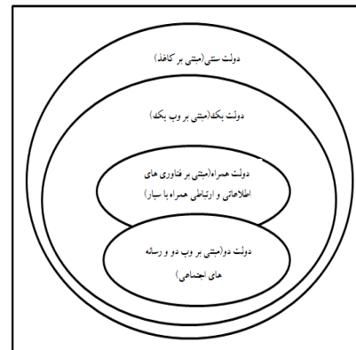
سناریو سه: دولت دو ترکیبی