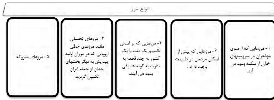
شکل ۱. انواع مرزها

گاهی مرزهای رودخانه‌ای بنا بر دلایل مختلف موجبات کشمکش بین دو کشور همسایه را فراهم می‌کند. در واقع، رقابت بین کشورها خصوصاً برای منابع آب مشترک و دستیابی به منابع آب شیرین می‌تواند به دلیل تلاش کشورها برای دستیابی به امنیت ملی باشد. منابع آب کافی برای یک کشور به معنای توسعه در بخش کشاورزی، غذای کافی، رشد اقتصادی، و رفاه عمومی است. امنیت آب به‌ویژه در مناطق خشک و نیمه‌خشک به امنیت ملی مربوط می‌شود. آب از مهم‌ترین شاخص‌های امنیتی در کشورهای خاورمیانه است، چون دستیابی به منابع آبی قابل اعتماد (از نظر کمی - کیفی) به معنای برخورداری از ظرفیت و پتانسیل لازم برای توسعه اقتصادی و اجتماعی و در یک کلام بهبود استانداردهای زندگی و رفاه اجتماعی خواهد بود. برآیند چنین وضعیتی تحکیم نظام سیاسی و افزایش امنیت ملی است (عسکری، ۱۳۸۱: ۵۰۰). به‌ویژه اگر که این منبع آب به‌عنوان یک مرز سیاسی بین دو کشور باشد، مانند هیرمند، کمبود این مادهٔ زیستی می‌تواند باعث تشدید فقر و کاهش رفاه جامعه شود و امنیت ملی را تضعیف کند. بنابراین، شناسایی وضعیت بهینه برای مرزهای رودخانه‌ای و مشخص کردن تهدیدهای امنیتی ناشی از استقرار عوارض طبیعی - انسانی مسئلهٔ بهینه‌سازی ترکیبی است که با استفاده از تحلیل‌های مکانی سامانهٔ اطلاعات جغرافیایی GIS امکان‌پذیر می‌شود.