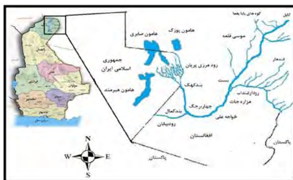
شکل ۳. موقعیت و مسیر رودخانه هیرمند در سیستان ( https://gsi.ir/zahedan/fa/page/2936 )

همچنین، در مورد حوزه رودخانه‌های دجله و فرات بین سه کشور ترکیه در بالادست و سوریه و عراق در پایین‌دست نیز چنین بازی‌هایی برقرار است (کوچوک مهمتوغلو و گلدمن، ۲۰۰۴: ۳۱).