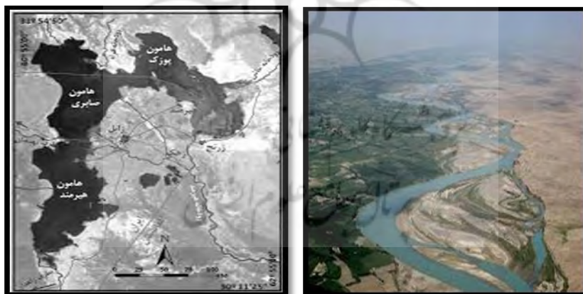
شکل ۴. تغییر در عرصه‌های آبی هامون به زیان بخش ایرانی (هامون صابری) و به نفع بخش افغانی (هامون پوزک) https://hsm.sp.modares.ac.ir/article-21-6406-fa.pdf

- از سوی دیگر، همین معاهده نیز به‌درستی اجرا نشده و عملاً دولت ایران حتی به حقوق مندرج در آن نائل نیامده است. همچنین، با توجه به تصاویر ماهواره‌ای و عکس‌های هوایی عوامل طبیعی به نفع افزایش حقایق افغانستان عمل کرده و پیش‌بینی می‌شود باعث جدال و کشمکش‌های چند سال آینده شود. داده‌های موجود تغییر در عرصه‌های آبی هامون را - که به زیان بخش ایرانی (هامون صابری) و به نفع بخش افغانی (هامون پوزک) است - تأیید می‌کند. مقایسه عرصه‌های آبی شده هامون در مقاطع زمانی با ارتفاع آبی برابر و بهره‌گیری از قانون ظروف مرتبط مؤید کاهش مساحت دریاچه به ۳۵۷ کیلومتر مربع (۶,۱۰٪-) است. توزیع فضایی این کاهش یکسان نبوده و در بخش ایرانی آن (هامون هیرمند) ۷۷۷ کیلومتر مربع از عرصه آبی کاسته شده است؛ در حالی که عرصه جدیدی به مساحت ۴۹۲ کیلومتر از بخش‌های غیر آبیگیر هامون پوزک در افغانستان آب‌گیر شده است. پویش علل و عوامل شکل‌گیری این رویداد تغییر در بستر هامون از طریق افزایش ارتفاع را تأیید می‌کند که حاصل از انباشت رسوب‌های بادی به واسطه احداث موانع در مسیر حرکت طوفان‌های شن است. این موانع با هدف‌های عمرانی (جاده و دیوار ساحلی) احداث شده‌اند؛ اما بی‌توجهی به مسائل زیست‌محیطی در احداث آن تبعاتی مانند جلوگیری از حرکت طوفان‌های شن و انباشت آن در بخش‌های جنوبی هامون را به دنبال داشته است (شریفی کیا، ۱۳۸۹: ۱۵۵).