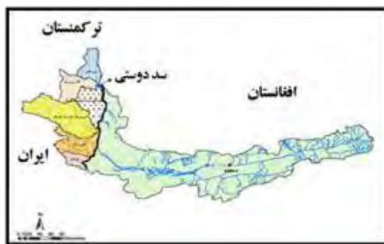
شکل ۵. موقعیت جغرافیایی رودخانه مرزی هریرود