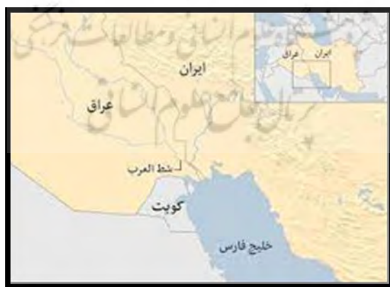
شکل ۷. موقعیت جغرافیایی شط‌العرب

رودخانه شط‌العرب با ۹۴ کیلومتر مرز مشترک و حدود دو میلیارد متر مکعب آبدهی سالانه مهم‌ترین رود مشترک مرزی ایران و عراق است که به دلیل قابلیت کشتیرانی و راه ورودی به خلیج فارس برای هر دو کشور از اهمیت فوق‌العاده‌ای برخوردار است. طبق توافق ایران و عراق در ۲۶ دسامبر ۱۹۷۵، مرز بین دو کشور خط تالوگ شط‌العرب تعیین شده است. از نظر ژئوپلیتیکی، شط‌العرب مهم‌ترین راه دسترسی عراق به خلیج فارس است. بر این بنیاد، مهم‌ترین مسائل بین ایران و عراق اختلافات مرزی است. اختلاف‌های مرزی و سرحدی ایران و عراق نمی‌تواند از اختلاف‌های سیاسی ایدئولوژیک آن‌ها جدا باشد. درواقع، اختلاف‌های سیاسی ایدئولوژیک دو کشور همیشه تحت پوشش اختلاف‌های مرزی بروز کرده است (پارسا، ۱۳۹۱: ۱۰۲).