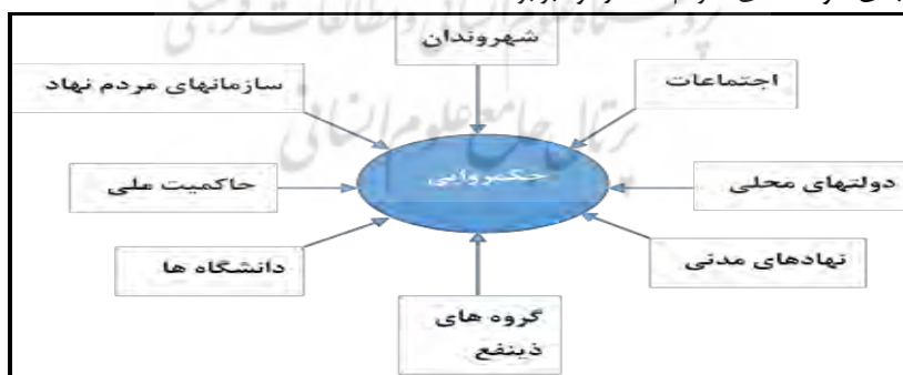
شکل ۱- ذینفعان و مشارکت کنندگان اصلی در الگوی حکمروایی شهری

داشتن الگویی برای کلان شهرهای کشور جهت برآورده ساختن نیازهای کنونی کلان شهرها همسو با استانداردهای جهانی و مطالبات به حق مردمی امری ضروری و حیاتی است. یکی از جالب ترین و موفقیت آمیزترین الگوها در زمینه مدیریت شهری، الگوی حکمروایی شهری است که در واقع یک سیستم مدیریت شهری به شکل مشارکتی می باشد، که سه نهاد جامعه مدنی، بخش خصوصی و دولت در تمامی تصمیم گیری های مربوطه مشارکت می کنند. این الگو، با معیارهایی چون مشارکت، شفافیت، پاسخگویی، قانونمندی، عدالت، کارایی و اثربخشی و جهت گیری توافقی که بر بینش راهبردی و تمرکززدایی تاکید دارد به عنوان اثربخش ترین، کم هزینه ترین و پایدارترین شیوه اعمال مدیریت نظام پیچیده و چند سطحی امروزه شهرها، مطرح شده است. محوریت این رویکرد در مدیریت شهری، بر مبنای توسعه ای مردم سالار و برابر