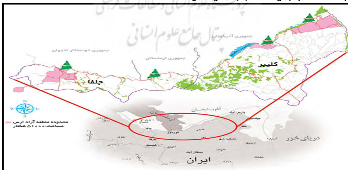
نقشه ۱ - موقعیت جغرافیایی منطقه آزاد ارس ( http://www.arasfz.ir/aras/aras-free-zone/location )

منطقه آزاد ارس در شمال غرب ایران در نقطه صفر مرزی در مجاورت با کشورهای ارمنستان، آذربایجان و جمهوری خودمختار نخجوان استقرار یافته است. بر اساس مصوبه هیأت وزیران در تاریخ ۱۳۸۴/۴/۷ به شماره ۲۰۷۰۸/ت/۵۳۰۸۲۰ محدوده منطقه آزاد ارس شامل ۹۷۰۰ هکتار از اراضی منطقه می‌شد که براساس مصوبه جدید این هیأت محترم در ۱۳۸۷/۹/۱۴ محدوده این منطقه به ۵۱ هزار هکتار شامل بخش‌هایی از ۲ شهرستان جلفا و خداآفرین افزایش یافت. این محدوده ابلاغی در بخش متصل، محدوده اصلی را از ۹۷۰۰ هکتار به ۲۰۵۰۰ هکتار افزایش داده است و در ۳ بخش منفصل