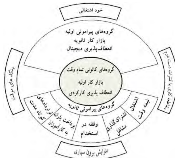
شکل ۳: ساختار کار تحت وضعیت انباشت منعطف پسا فور دیسم