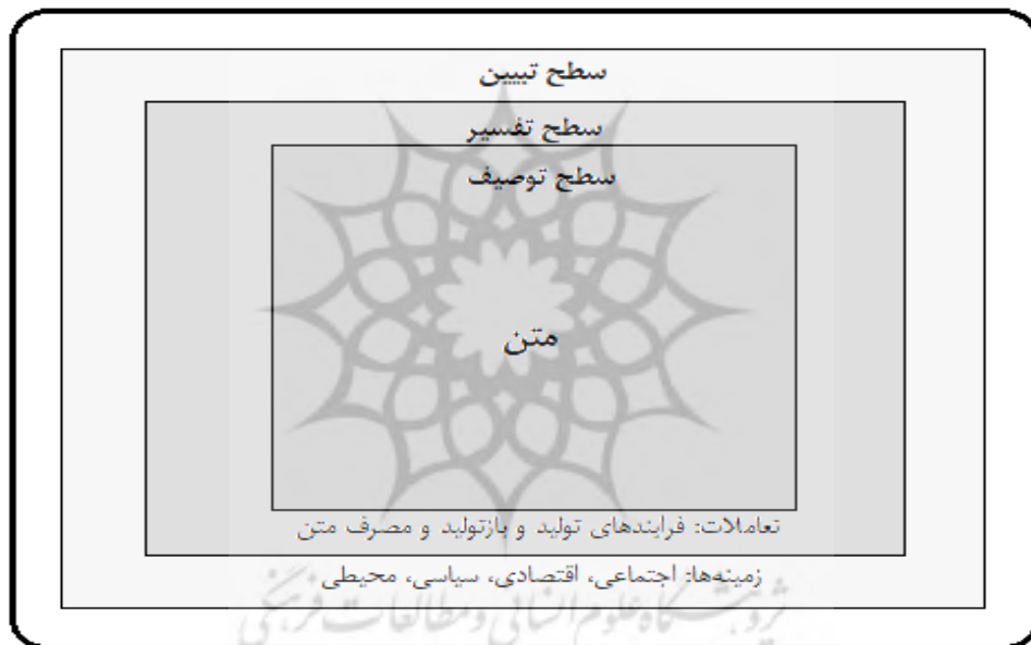
شکل ۲: چارچوب سه‌بعدی پیشنهادشده توسط فرکلاف (۱۹۹۲)

۳- در مقیاس محلی و خرد نیز زمینه‌ها و فرایندهای کالبدی- فضایی و زمینه‌های مربوط به اجتماعات محلی و خانوارها تفسیر شد.