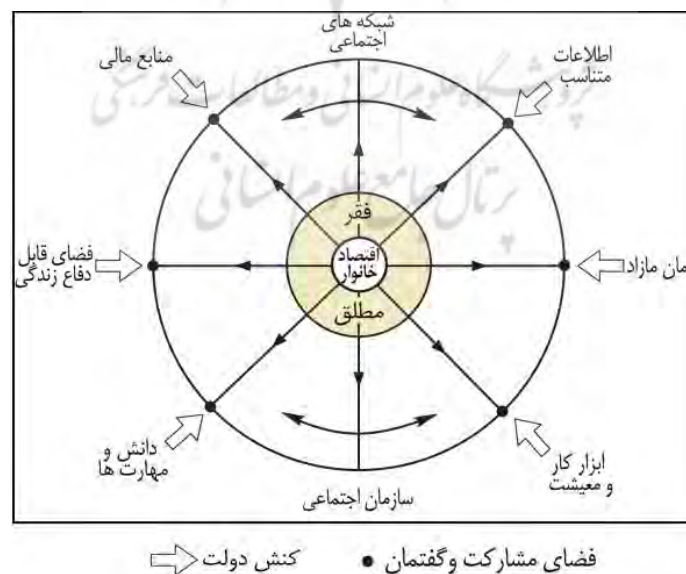
شکل ۴: بنیادهای قدرت اجتماعی خانوار از منظر جان فریدمن

و نیز تکرار نرخ دورقمی تورم (از دهه ۱۳۵۰)، زمین و مسکن با شدت هرچه‌تمام‌تر از ارزش مصرف فاصله گرفته و به حیطة ارزش مبادله وارد شده‌است. به این ترتیب رانت ناشی از ارزش مبادلاتی زمین و مسکن و سود ناشی از جابه‌جایی درآمدها در این بخش به نیرویی عمده برای شکل‌گیری طبقات اجتماعی در این شهر تبدیل شده‌است؛ بنابراین اسکان خانوارها در تهران، به‌شدت طبقاتی شده و برپایه توان اقتصادی و مالی خانوارها، محله‌هایی از شهر به سکونت هریک از اقشار و گروه‌های اجتماعی اختصاص یافته است، در نتیجه نابرابری در بین و درون مناطق شهری تهران قوام و دوام یافته است؛ براین‌اساس، آنچه در ساختار نابرابر تهران حرف اول را می‌زند و مرزهای طبقات و اقشار اجتماعی را بازمهندسی می‌کند، توان اقتصادی و مالی است (رئیس‌دانا، ۱۳۸۱: ۲۳۴-۲۳۳). نبود تحرک در تولید، فقر گسترده را نیز به همراه دارد (عظیمی‌آرانی، ۱۳۸۸: ۱۱۸). امروزه پدیده فقر