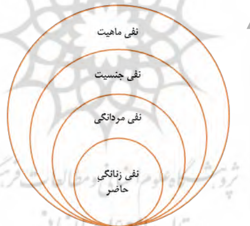
نمودار ۴. مراتب نفی در پوچ‌گرایی فمینیستی و جنسیتی.

برای آن که من خودم باشم، لازم است که زن نباشم و گرنه باید از تعاریفی که برای زن بودنم تعیین شده‌اند پیروی کنم. برای این کار لازم است که مردی نباشد، که بر اساس آن من به عنوان آن جنس دیگر توضیح داده شوم. و برای این کار لازم است که اصلاً جنسیتی نباشد که آدم‌ها بر اساس آن به مرد و زن تقسیم شوند. و باز برای این که جنسیتی نباشد، لازم می‌آید که اساساً ماهیتی برای انسان وجود نداشته باشد که بخواهد