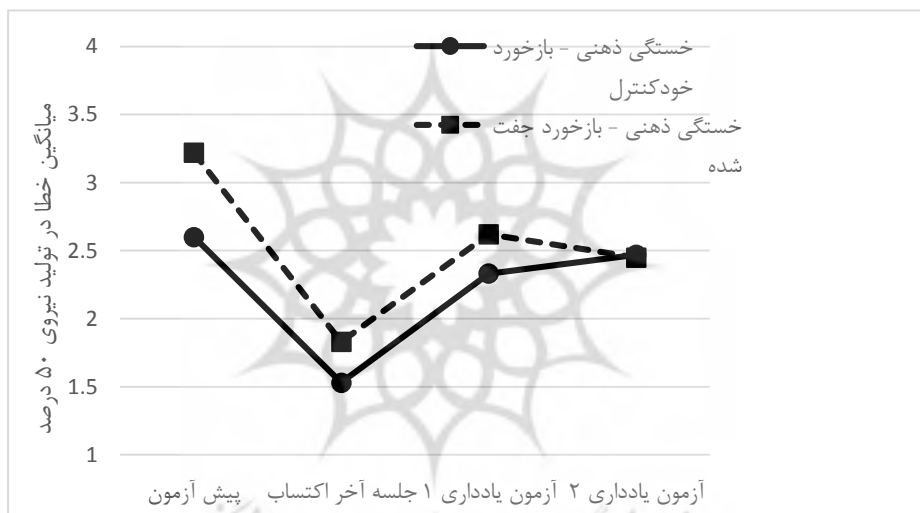
شکل ۲. عملکرد گروه‌های تحقیق در تولید نیروی ۵۰ درصد

نتایج درون گروهی در جدول ۳ نشان می‌دهد، اثر جلسات تمرین در شرایط خستگی ذهنی معنادار است ( P \leq 0/05 )، بدین معنی که گروه‌های تحقیق از پیش‌آزمون تا جلسه آخر اکتساب و آزمون‌های یادداری تغییر معناداری دقت تولید نیروی ۵۰ درصد داشته‌اند. نتایج آزمون‌های تعقیبی نشان داد که این پیشرفت معنادار فقط در گروه بازخورد خودکنترل و فقط بین پیش‌آزمون و جلسه آخر اکتساب وجود دارد. بدین معنی که در شرایط خستگی ذهنی بازخورد خودکنترل تنها بر اکتساب نیروی ۵۰ درصد تأثیر معنادار داشته ( P = 0/01 )، اما بر یادگیری تأثیر معناداری نداشته است ( P \geq 0/05 ). همچنین نتایج تأثیرات بین گروهی نشان داد که بین گروه خستگی ذهنی - بازخورد خودکنترل و گروه خستگی ذهنی - بازخورد جفت‌شده در دقت تولید نیروی ۵۰ درصد تفاوت معناداری وجود ندارد ( P \geq 0/05 ) (شکل ۲).