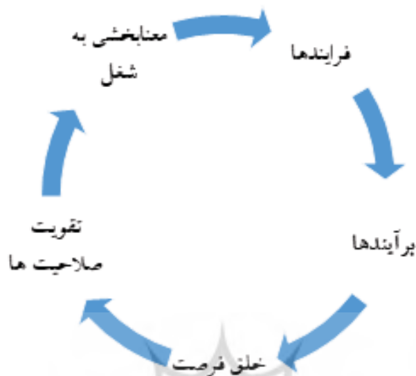
زنجیره لایه‌های انسجام‌بخشی و جاری‌سازی رویکردهای نظام ارزیابی

در نهایت، بر اساس یافته‌های به دست آمده عامل هدف‌مداری دانشگاه، چهارمین عامل مرتبط با فرهنگ ارزیابی در دانشگاه شناسایی شد. در این عامل، به ترتیب مؤلفه‌هایی نظیر: شرح دقیق شغل سازمان برای تمام همکاران اداری و آموزشی، روشن بودن اهداف و رسالت دانشگاه فرهنگیان، استفاده از نتایج ارزیابی در راستای انجام بهتر امور و شکل‌گیری ساختاری مشخص و مدون، در حوزه ارزیابی جای گرفته‌اند.