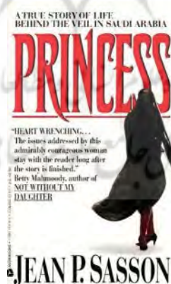
تصویر ۱- طرح جلد ۱۹۹۲

منظور کاهش آلام آنها بلکه صرفاً از جنبه‌ بشر دوستانه جهانشمول آن (لیوون و جوئیت، ۱۲۵). بنابراین آنچه از طریق این طرح‌جلد در ذهن مخاطب رقم خواهد خورد حفظ انگاره‌ دوگانه «زن غربی/زن شرقی»- به تبع «غرب/شرق»- و ایجاد نوعی خوش‌بینی نسبت به وضعیت حقوق زن در غرب است؛ به دیگر سخن، آنچه بیش از پیش در این طرح‌جلد خودنمایی می‌کند ایجاد نوعی "برتری اخلاقی" و توهم برتری‌جویانه است که به سسون این فرصت را می‌دهد که جایگاه خود را در ابتدای «صف تاریخ بشری» تحکیم کند؛ به این معنا که در تقابلی که بین زن شرقی و سسون در ذهن خواننده شکل می‌گیرد سسون در دید خواننده به منزله‌ زنی روشنفکر، مستقل و خودآگاه مجسم می‌شود که برخلاف زن سوژه تصویربر روی بدن خویش کنترل دارد. به علاوه نویسنده با خلق «تفاوت‌هایی» از این نوع بین آنچه آشنا و «غریب» ۱ است تمایز ایجاد می‌کند و "خواننده سفیدپوست را قانع می‌نماید که قرار است در متن با اقوام و سرزمین‌هایی روبه‌رو شوند که به قدر کفایت ناآشنا هستند" (لیزل، ۲۷۲). نتیجه‌ اعمال این منطق «تشابه و تفاوت»، از یک سو، تثبیت جایگاه نویسنده به منزله‌ سوژه آگاه و فرهیخته (در مقابل شرقی غیرتمدن) است که چون والدی مهربان نگران و ناراحت سرنوشت شوم «خواهران جهانی» خویش است. (همان، ۸۵). از دیگر سو، پررنگ کردن این تفاوت‌ها از سسون چهره‌ای قهرمان‌گونه می‌سازد، شوالیه‌ای دلیر که در راه نجات «خواهران جهانی» خود ناگزیر از نبردی سخت علیه عقب‌ماندگی و خرافه‌محوری حاکم بر مشرق‌زمین است.