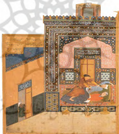
تصویر ۳. «شیرویه خسرو را به قتل می‌رساند»، خمسه نظامی، هرات، ۸۹۹ق. بهزاد، کتابخانه بریتانیا.

خسرو و شیرویه را در این لحظه دلخراش به زیباترین شکل ممکن به نمایش گذاشته است. شیرویه در حالی که با دست راست خنجر را به پهلوئی خسرو فرو کرده است، دست چپش را روی گلوی خسرو می‌فشارد. عکس‌العمل خسرو نیز کاملاً طبیعی است، وی در حالی که بازوی قاتل را محکم می‌فشارد، دست راستش را از درد بالا برده است. دهان بسته و چهره گرفته خسرو در این لحظه، به خوبی بیانگر فریاد بی‌صدای اوست که در تضاد با چهره آرام و شیرین خفته است. فهم صحیح این نگاره، منوط به خوانشی دقیق از داستان نظامی است، چرا که تضاد موجود در چهره آرام شیرین در خواب با چهره درهم کشیده خسرو در آستانه مرگ، تنها زمانی قابل درک خواهد بود که مخاطب از عشق وافر خسرو به شیرین مطلع باشد (همان، ۱۴۱). بهزاد این نگاره را با دیدی سه وجهی رقم زده است. دید از بالا در نمایش جایگاه خواب شیرین و خسرو، دید از پهلو در نمایش درب ورودی و دید از روبه‌رو در نمایش جام‌هایی که در پایین جایگاه خواب شیرین و خسرو قرار گرفته کاملاً نمایان است.