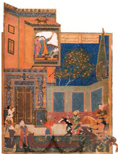
تصویر ۳. «خسرو بر در قصر شیرین»، خمسه نظامی ، هرات، ۸۹۵ ق. منسوب به بهزاد، کتابخانه بریتانیا. (بهارى، ۱۹۹۷، ۱۲۰)

۶-۲-۳- صحنه دیدار عاشق و معشوق پس از فراقی طولانی در رمان نام من سرخ در رمان نام من سرخ می‌خوانیم که نگاره مذکور (تصویر ۳) به همراه حکایت نظامی، تأثیری ژرف بر قارا افندی دل داده می‌گذارد، به طوری که وی نخستین لحظه دیدار شکوره را، با اندکی تفاوت، تکرار همان صحنه‌ای می‌داند که خسرو با اسب خویش در درگاه قصر شیرین به انتظار رخ‌نمایی یار است و ناگهان شیرین همچون قرص ماه بر در سرای ظاهر می‌شود. قارا افندی این لحظه را این‌گونه شرح می‌دهد، «ناگهان خفگی که برف پشت آن نشسته بود، به سختی باز شد. در قاب پنجره‌ای که زیر نور خورشید می‌درخشید، محبوب زیبایم را بعد از دوازده سال دیدم. صورت زیبایم را پشت شاخه‌های پوشیده از برف نظاره کردم. چشمان سیاهش مرا می‌نگریست یا دنیای ورای مرا؟ نفهمیدم غمگین بود، لبخند می‌زد یا غمگنانه لبخند می‌زد. اسب ساده‌دل! فریب قلبم را نخور! آرام بگیر. جسورانه برگشتم و مشتاقانه آن‌قدر تماشايش کردم که چهره رازآلود، ظریف و کوچکش پشت شاخه‌های سپید از برف محو شد. ...فهمیدم حالت من که روی اسب نشسته بودم و او که پشت پنجره ایستاده بود، چقدر به مجلسی شباهت دارد که هزاران بار نقاشی شده است. مجلس آمدن خسرو کنار پنجره شیرین.