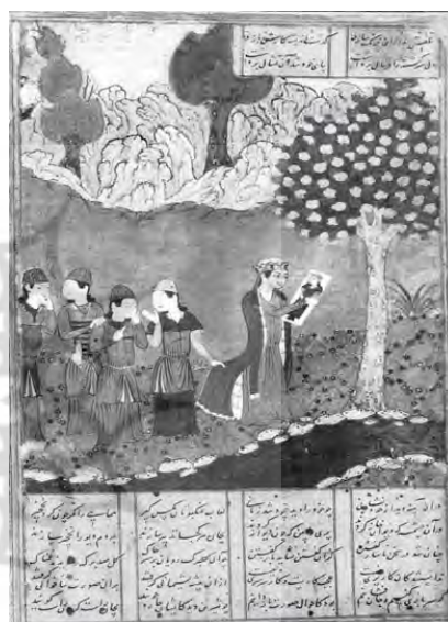
تصویر ۱، «شیرین به تصویر خسرو می‌نگرد»، خمسه نظامی، هرات، ۸۹۵ ق. کتابخانه بریتانیا. تصویر ۲، «شیرین به تصویر خسرو می‌نگرد»، خمسه نظامی، هرات، ۸۹۹ ق. منسوب به میرک، کتابخانه بریتانیا. (بهارى، ۱۹۹۷، ۱۲۹). (همان، ۱۳۷)

نسخه دیگر این نگاره متعلق به خمسه نظامی محفوظ در کتابخانه بریتانیاست که برای امیرعلی فارسی، یکی از امیران سلطان حسین بایقرا در هرات کار شده است. در یکی از نگاره‌های این مجموعه تاریخ ۹۰۰ ق. آمده است که می‌توان آن را تاریخ تولید این خمسه به حساب آورد (بهارى، ۱۹۹۷، ۱۲۹). کاتب این مجموعه مشخص نیست، اما این نگاره منسوب به آقا میرک است. آقا میرک نقاش، استاد بهزاد بوده است. هیچ نگاره امضاداری از میرک باقی نمانده است اما یکی از آثار منسوب به وی، نگاره «شیرین به عکس خسرو می‌نگرد»