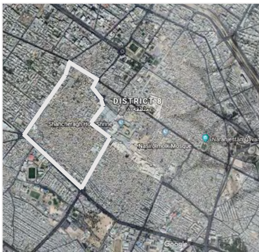
تصویر ۳- موقعیت محله سنگ سیاه در منطقه ۸

منطقه تاریخی و فرهنگی شهر شیراز با وسعت تقریبی ۳۷۸ هکتار بخشی از محدوده مرکزی (C.B.D) شهر شیراز را شامل می شود که امروزه منطقه ۸ شهرداری شیراز را تشکیل داده و خود دارای شهرداری مستقل است. این منطقه علاوه بر این که هسته اولیه پیدایش شهر شیراز بوده، در حال حاضر نیز بسیاری از فعالیت های مرکزی تجاری، مذهبی، خدماتی و اداری را در خود جای داده و ظرفیت های بالفعل و بالقوه قابل توجهی جهت رونق فعالیت های سیاحتی، زیارتی، تجارتی، فرهنگی و مسکونی دارد (وارثی و همکاران، ۱۳۹۱: ۱۳۳). بافت تاریخی شیراز از هشت محله بالاگفت، لب آب، سر دزک، سنگ سیاه، اسحاق بیگ، درب شازده، میدان شاه و درب مسجد تشکیل شده است که هر کدام دارای ویژگی های خاص خود هستند؛ به طور کلی این محله ها از حیث فرسودگی، پایین بودن سطح درآمد، حضور اقشار سنتی در کنار مهاجران تازه وارد، کمبود خدمات شهری و کهن سالی جمعیت با یکدیگر وجه اشتراک دارند. محله سنگ سیاه با جمعیتی در حدود ۴۶۹۴ نفر و مساحت تقریبی ۵۴ هکتار، یکی از محله های حاشیه ای بافت تاریخی شیراز است و در غرب منطقه تاریخی-فرهنگی شهر شیراز قرار دارد (شیبانی و موسوی، ۱۳۹۳: ۱۳) که از لحاظ عناصر تاریخی و ارتباط و انسجام درون محله ای از وضعیت بهتری نسبت به سایر محلات بافت برخوردار است (وارثی و همکاران، ۱۳۹۱: ۱۳۸)؛ باین وجود، روند نزولی که طی سال های اخیر از نظر کیفیت زندگی و گردشگری پیش گرفته ضرورت اتخاذ برنامه ای مناسب جهت توسعه و بازآفرینی این محله را ایجاب می کند و به نظر می رسد با توجه به تصویر نسبتاً خوب محله سنگ سیاه در ذهن شهروندان و گردشگران، رویکرد برند سازی محرک مناسبی برای بازآفرینی این محله باشد.