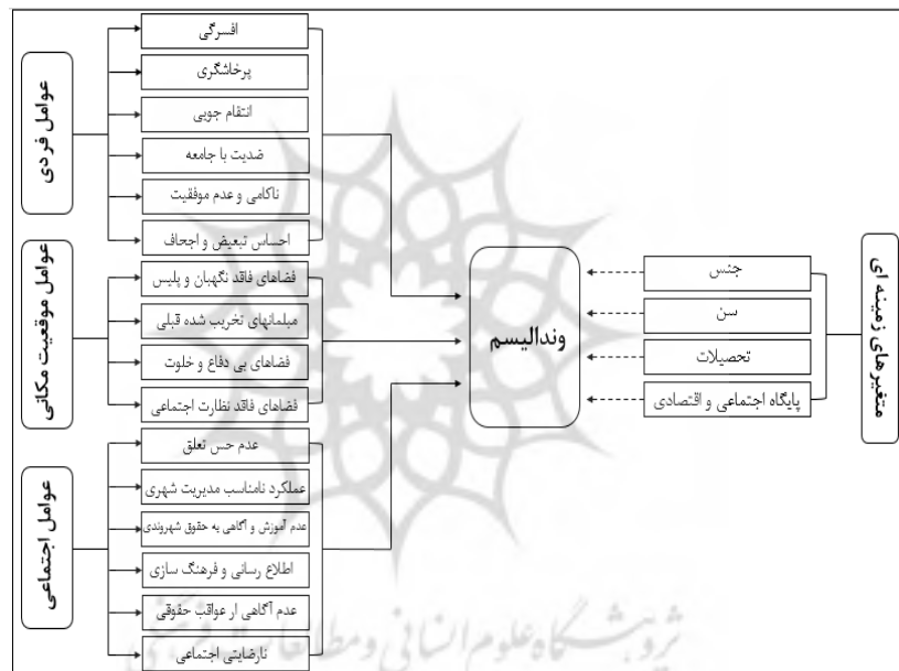
تصویر ۱- مدل مفهومی پژوهش

رفتارهای، نظریه‌ی آنومی ۶ است که در زبان فارسی به بی‌هنجاری ترجمه شده است. در تعریف او از آنومی اشاره به نوعی بی‌سازمانی ۷ ، اغتشاش ۸ ، گسستگی ۹ و بی‌هنجاری در نظام جمعی دارد. دورکیم بی‌هنجاری را در دو سطح فردی و اجتماعی به کار می‌برد (محسنی تبریزی، ۱۳۸۳: ۵۲). پس از دورکیم رابرت مرتن جامعه‌شناس آمریکایی نظریه‌ی خود را بر پایه‌ی نظریه او تعمیم داد. به عقیده او این شرایط ساختی خاص است که علت ریشه‌ای انحرافات اجتماعی است. او به ارزش‌یابی انحراف یا جنایت علاقمند نبود، بلکه درصدد بود تا ریشه‌های اجتماعی و ساختی گرایش افراد به راه‌های نامطلوب کنش توضیح دهد (معید فر، ۱۳۸۵: ۳۸). رابرات اگنیو نظریه فشار عمومی را به عنوان یکی از نظریات پیش‌رو در بررسی جرم، با تمرکز به علل و انگیزه‌های فردی ر سال ۱۹۲۲ تدوین نمود. اگر چه تحقیقات اندکی از نظریه کلاسیک فشار، که جرم را ناشی از آرزوهای تحقق نیافته‌ی اقتصادی می‌دانست، حمایت کرده بودند، نظریه فشار عمومی اگنیو این نظریه را بسط داد و علاوه بر افزودن سایر منابع فشار، احساسات منفی را به عنوان متغیر میانجی مورد توجه قرار داد. اگنیو فشار را به صورت به عنوان یک پدیده‌ی روانی - اجتماعی در نظر می‌گیرد (Rebellion, et al, 2009: 48). ویلیام گود با کمک گرفتن از مفهوم آنومی و تعمیم آن به نهاد خانواده به عنوان مهم‌ترین آژانس اجتماعی کننده، ساختار خانواده، سازمان و انگاره‌های آن را کلیدی برای شناخت شخصیت و رفتار فرد پرورش یافته در آن تلقی می‌کند و هرگونه نا به سامانی و بی‌سامانی در این نهاد و ساختار آن را در بروز توسعه و تکوین شخصیت بزهکار و کجرو دخیل می‌داند (محسنی تبریزی، ۱۳۸۳: ۶۸).