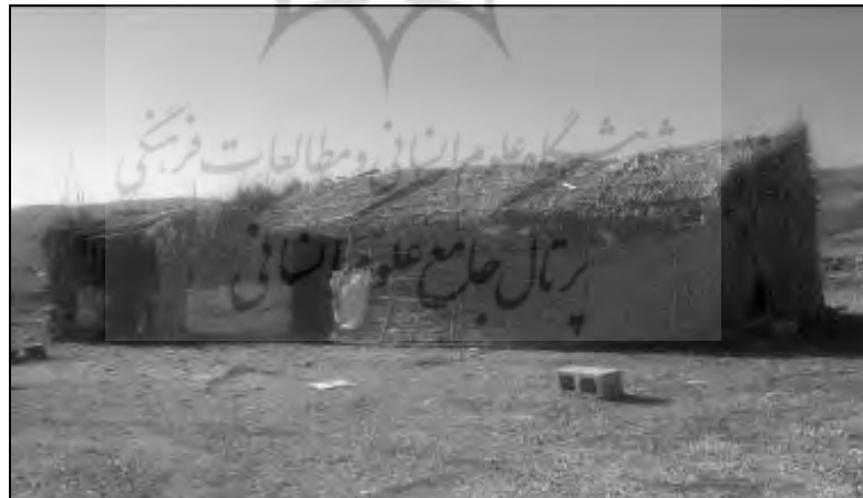
تصویر ۱- نمونه‌ای از کپرها (مساکن روستایی) رایج در چمگل در دوره اولیه با مصالح بومی (۲۵-۱۳۱۰)

در این دوره که مدت ۱۵ سال (۱۳۱۰ تا ۱۳۲۵ هجری شمسی) به طول انجامید، اولین گروه به تعداد ۱ الی ۲ خانوار در سال ۱۳۱۰ هجری شمسی در روستای چمگل سکنی گزیدند. سایت انتخابی جهت اسکان توسط این خانوارها بر روی تپه‌ای در شمال غربی بافت قدیم روستا واقع شده است. شغل خانوارهایی که در طی مدت این دوره در روستا ساکن شدند کشاورزی و دامداری بوده است. به همین دلیل و همچنین عدم وجود راه‌های ارتباطی و وسایل ماشینی، عمده مصالح استفاده شده جهت برپایی مسکن و سرپناه از نی، چوب درختان بید، شاخه و ساقه و خار درخت کنار بوده است. (تصاویر شماره ۱ و ۲). به دلیل تعداد کم اعضای خانواده معمولاً از نی و چوب درخت بید «کپر» را برای سکونت احداث و برپا می‌کردند که معمولاً اندازه‌ای در حدود ۳ در ۴ متر داشته است و از درخت «رملک» محدوده‌ی حیاط را تعیین می‌کردند. معمولاً احشام در همین حیاط و در نزدیکی کپر درون آغل (محصور شده از خار) نگهداری می‌شده است. دلیل استفاده از مصالح فوق فراوانی وجود این مصالح در محیط پیرامون روستا بوده است. در این دوره جهت تعیین ورودی محوطه زندگی خانوارها و همچنین ورودی به آغل حیوانات و محل نگهداری دام از شبکه‌ای چوبی که در داخل آن از همان مصالح (خارمانند) پر شده بود، استفاده می‌کردند.