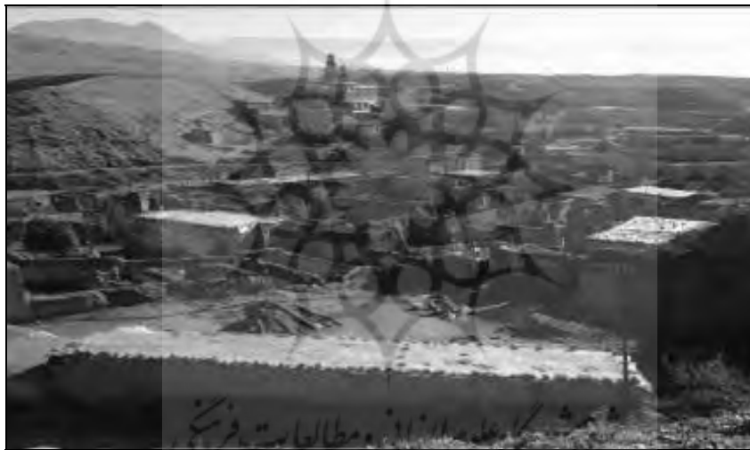
تصویر ۲- نمای کلی از سایت قدیم روستا در دوره دوم، محصور در پایین دست و فضای تحت کنترل (۴۲-۱۳۲۵)