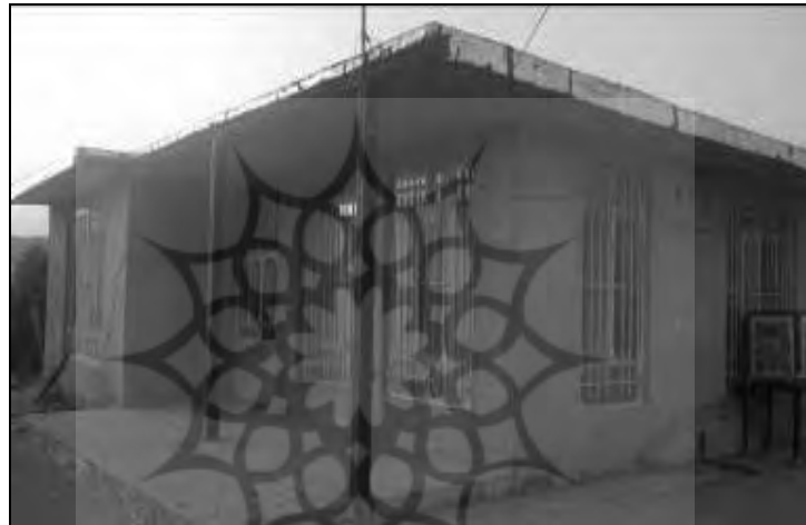
تصویر ۱۲- مسکن روستایی در چمگل مربوط به دوره پنجم با طراحی نسبتاً مدرن (۸۰-۱۳۶۸)

به لحاظ چیدمان فضایی و آرایش درون منازل، فضاهای سرویس بهداشتی و حمام از گوشه‌های حیاط به داخل خانه جابجا شده است. تعداد اتاق‌های خواب به ۲ و ۳ اتاق افزایش یافت و فضای هال ماندنی در وسط منزل جهت دسترسی سریع و آسان به دیگر فضاهای مختلف خانه ایجاد شده است و اتاق‌ها اصولاً دارای درب ورودی و خروجی شدند و فضاهای خصوصی در منزل نمود بیشتری پیدا کرد.