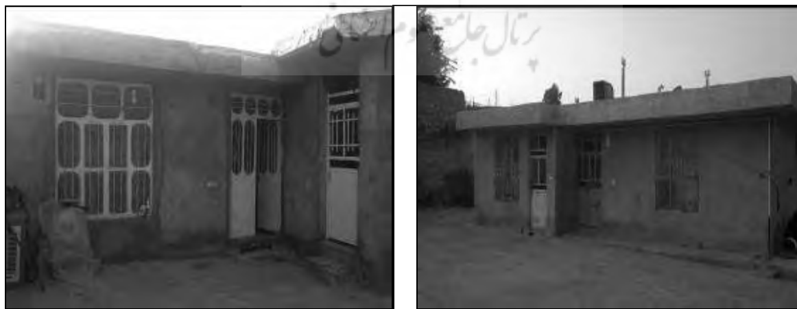
تصویر ۱۰ و ۱۱- مساکن روستایی در چمگل مربوط به دوره چهارم با استفاده از مصالح بلوک و سیمان (۶۸-۱۳۵۷)

این دوره مقارن با پیروزی انقلاب اسلامی و به مدت ۱۱ سال (۱۳۵۷ تا ۱۳۶۸ هجری شمسی) می‌باشد. با پیروزی انقلاب اسلامی و ارائه خدمات از سوی نهادهایی مانند بنیاد مسکن، جهاد سازندگی و فرمانداری به روستاها و همچنین بسط روابط روستانشینان با شهرها و الگوپذیری از این مراکز؛ طرح عمومی منازل مسکونی از حیاط مرکزی به خانه‌های مجتمع تغییر پیدا کرد. به واسطه ارتباطات با دیگر نواحی مسکونی در منطقه همچنین استفاده از خشت محدود و استفاده از گچ و سنگ و تیر آهن فزونی گرفت. ساخت خانه‌هایی با نشیمن ۴ در ۴ در وسط و آشپزخانه ۳ در ۴ در یک سمت و پذیرایی ۳ در ۴ در سمت دیگر رونق پیدا کرد، و پوشش سقف این خانه‌ها از تیر آهن بوده است. (تصاویر شماره ۱۰ و ۱۱). شاید یکی از دلایل عمده این تغییر احساس نیاز به سرمایه‌گذاری و گرمایش توسط وسایل نفت سوز و همچنین جلوگیری از اتلاف حرارت بوده است. همچنین درب و پنجره‌ها نیز از پروفیل‌های آهنی و به صورت شیشه جهت استفاده از نور استفاده می‌شد. در بدنه فضاهای ذکر شده معمولاً طاقچه‌هایی در نظر می‌گرفتند تا برای نگهداری اسباب و اثاثیه مورد استفاده قرار گیرد. در این دوره جهت‌گیری خاصی برای ایجاد منازل مسکونی مد نظر نبوده و بیشتر چیدمان فضایی منازل و جهت‌گیری‌ها بر اساس سایت و مکان مورد استفاده منزل بوده است.