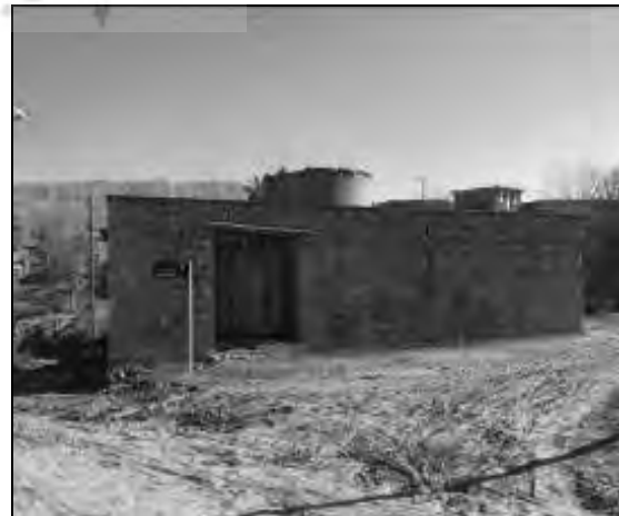
تصویر ۷ و ۸ - استفاده از مصالح بومی و گچ‌بری‌های مسکن در دوره سوم روستای چمگل (۵۷-۱۳۴۲)