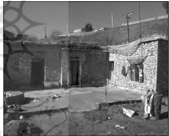
تصویر ۵ و ۶ - مسکن روستایی چمگل در دوره سوم با طراحی حیاط مرکزی و طرح دو طبقه (۵۷-۱۳۴۲)