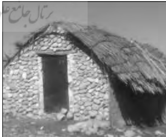
تصویر ۳ و ۴- شکل و نوع مسکن روستایی چمگل در دوره سوم با استفاده از مصالح بومی و روند تحولی آن (۴۲-۱۳۲۵)