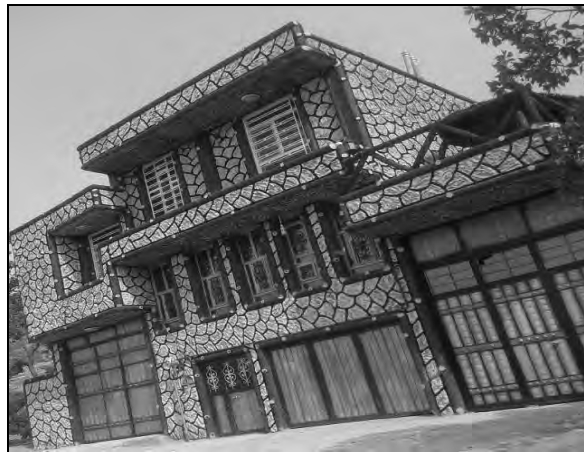
تصویر ۱۳ و ۱۴- مسکن روستایی در چمگل مربوط به دوره ششم با استفاده از مصالح نوین و طرح مدرن (۹۱-۱۳۸۰)