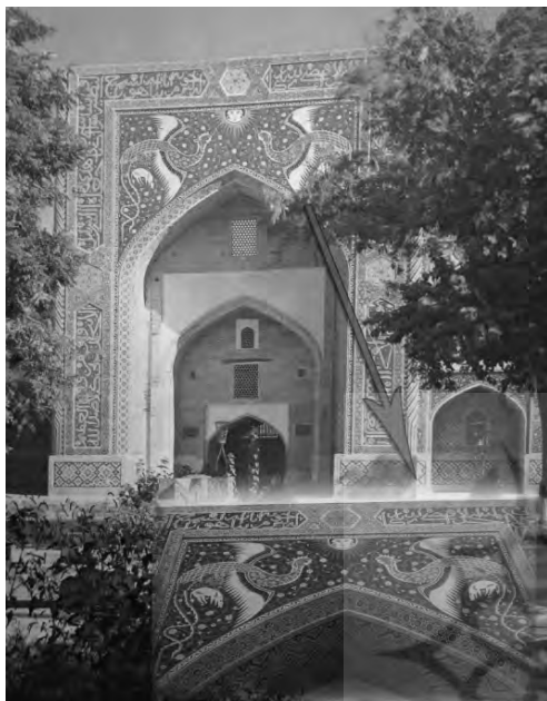
تصویر ۵) سردر مدرسه نادر دیوان بیگی.

چنانچه در منطق الطیر نیز مرغانی که در جستجوی سیمرغ، از جان گذشته و طی طریق کردند، همانی را می‌جستند که در درون خود داشتند ولی از آن غافل بودند. مفاهیم پیچیده و نمادین سیمرغ، آن را بدل به یکی از مهمترین نشانه‌های فرهنگ عرفانی ایران نمود که بر چهره معماری عصر مغول نیز راه یافت. جلوه این نماد را در دوره ایلخانی بر کاشی‌های کاخ‌ها همچون تخت سلیمان می‌توان دید (تصویر ۴). در دوره تیموری این نقش به معماری بناهای مذهبی نیز راه پیدا می‌کند. نمونه تصویر سیمرغ را در سردر مدرسه نادر دیوان بیگی در بخارا روبروی مدرسه الغ بیگ (تصویر ۵) می‌توان مشاهده نمود که متاثر شدن نقوش تزئینی معماری بناهای مذهبی تیموری از نمادها و مفاهیم عرفانی را نشان می‌دهد.