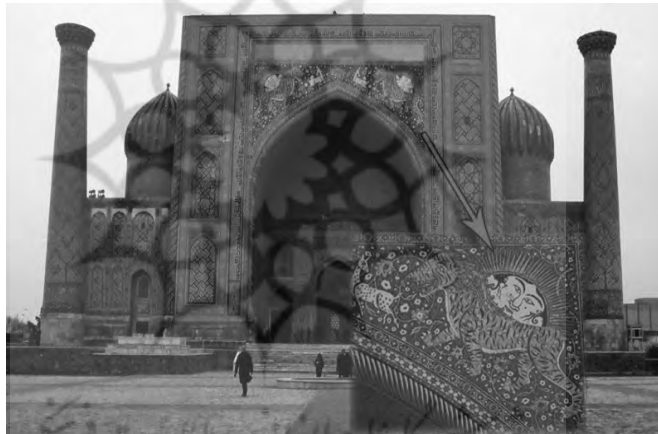
تصویر ۷ - سر در مدرسه شیردر سمرقند، مأخذ: (هاتشتاین، ۱۳۹۰: ۶۲).