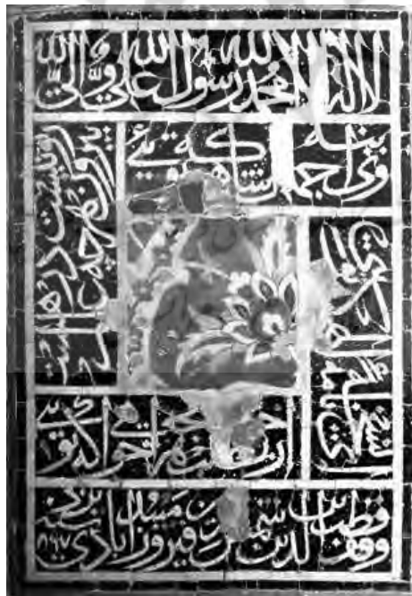
تصویر ۱ - کتیبه مسجد میدان کاشان، مأخذ: (شایسته فر، ۱۳۸۸: ۸۷)

مضامین عرفانی در کتیبه‌نگاری‌ها: تاثیرات عرفان بر کتیبه‌نگاری باعث شد تا مفاهیم عرفانی از طریق ادبیات عرفانی بر چهره معماری نیز بازتاب می‌یابد. تا قبل این دوران از آیه‌های قرآنی بیشتر به عنوان کتیبه و به منظور تزیین در بنا استفاده می‌شد، اما با رواج ادبیات عرفانی و نزدیکی مفاهیم به کار رفته در آن با قرآن، بهره‌گیری از اشعار عرفانی به عنوان کتیبه در معماری از دوره تیموریان رواج می‌یابد. در این کتیبه‌ها از اشعار شاعران بزرگی چون مولوی، سعدی، حافظ، جامی و قاسم انوار بهره گرفته شده است. از جمله بناهای این دوره که آراسته به کتیبه‌های حاوی مضامین عرفانی هستند، می‌توان به مجموعه شاه زنده، مدرسه دو در و مسجد شاه مشهد، زیارتگاه درب امام اصفهان، مسجد میدان کاشان، مسجد حوض غلوار هرات، اشاره نمود که در آن مفاهیم اشعار به کار رفته در کتیبه به خوبی با محل استفاده در بنا در تعامل است (شایسته فر، ۱۳۸۸: ۸۴). برای نمونه در مسجد میدان کاشان، کتیبه‌هایی به خط ثلث از اشعار مولانا وجود دارد (تصویر ۱) که جایگاه رفیع انسان را در نزد خدا که عرفا همواره به آن توجه می‌نمودند به خاطر می‌آورد.