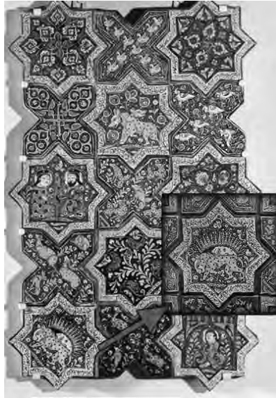
تصویر ۶ - نقش شیر خورشید بر کاشی‌های دوره ایلخانی، امام زاده جعفر دامغان، مأخذ: ( خزایی، ۱۳۸۰: ۳۷).