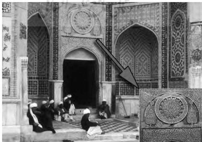
تصویر ۸ - نقش سرو در ایوان ورودی آرامگاه خواجه عبدالله انصاری در هرات (ارسن گازرگاه).