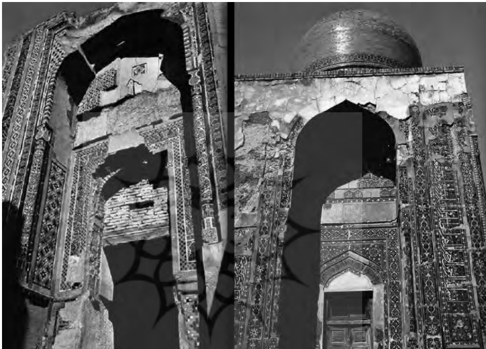
تصویر ۳) دیوار بیرونی آرامگاه شیرین بیگ آغا (چپ) و سردر ورودی آرامگاه تومان آغا (راست)، مأخذ: (هاتشتاین، ۱۳۹۰: ۴۹-۵۳)

از نکات قابل توجه در نگاره مذکور حفظ مراتب و شأن کلام و تصویر است. این حساسیت و توجه حتی به حفظ مراتب کلام الهی، و شعر که کلام انسانی است می‌انجامد. به عنوان نمونه، کلام الهی همواره در متن نگاره و اغلب بر روی فضاهای معماری بوده است که شأن و مرتبت آن حفظ گردد، اما اشعار که زبان انسان و بیان حال اوست، اغلب در خارج از نگاره تحریر شده است (رجبی، ۱۳۸۰: ۷۶۷). مضمون کتیبه قرار گرفته در ایوان اصلی، مانند بیشتر کتیبه‌های مورد استفاده بهزاد برای تزئین مساجد، مربوط به آیه ۱۸ از سوره جن است و بخشی از آیه نیز در صحن همجوار ادامه یافته است. این کتیبه به لحاظ فرم و رنگ و نه مضمون با کتیبه دیوار بیرونی آرامگاه شیرین بیگ آغا و سردر ورودی آرامگاه تومان آغا (تصویر ۳) با ترکیب رنگ لاجوردی و سفید شباهت دارد. کتیبه به خط کوفی در طاق نماهای دیوار بیرونی از وضوح کافی برخوردار نیست، اما نمونه‌های تقریباً مشابه آن را در ایوان‌های آرامگاه خواجه عبدالله انصاری در هرات با رنگ مشابه می‌توان دید (سدره نشین، ۱۳۹۱: ۳۴).