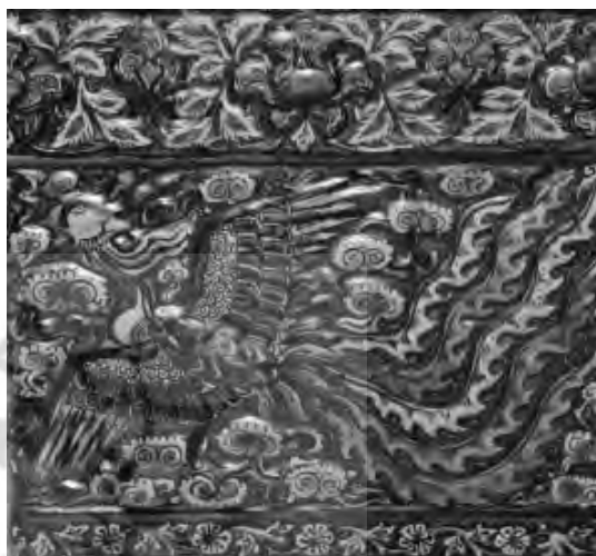
تصویر ۴) نقش سیمرغ بر کاشی دوره ایلخانی، تخت سلیمان، مأخذ: (حسینی، ۱۳۹۲: ۲۸).

یکی دیگر از نمادهای عرفانی که به صورت تصویر بر کاشیکاری در معماری این دوره استفاده شد، نقش شیر می‌باشد. نقش شیر گاهی با نقوش دیگری همچون خورشید ترکیب شده و نشان شیر خورشید را به وجود می‌آورد. نقش شیر و خورشید در طول دوره‌های مختلف در فرهنگ ایران مفاهیم مختلفی دارد. قدیمی ترین مفهوم نمادین نقش شیر و خورشید، مفهوم نجومی این نقش است که قدمت آن به هزاره چهارم قبل از میلاد برمی‌گردد. اما این نقش که از دوران سلجوقی به بعد در اماکن و اشیاء مذهبی طرح شده دارای مفاهیم عرفانی و مذهبی است. به طوری که خورشید نماد پیامبر اسلام و شیر نماد حضرت علی (ع) است (خزایی، ۱۳۸۰: ۳۷). در آثار عرفانی از حضرت محمد به عنوان خورشید عالم تاب یاد می‌شود. برای مثال شبستری از این گونه یاد می‌کند: