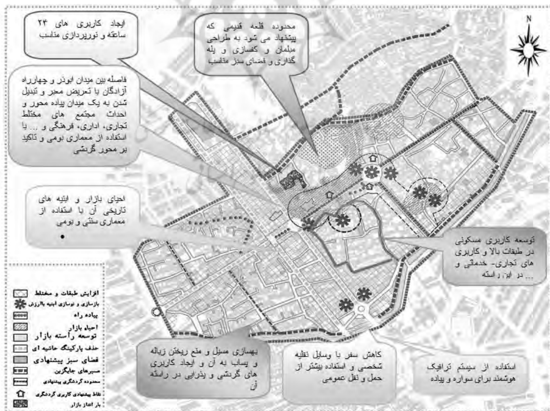
شکل ۲: احیا محدوده مرکز شهر با استفاده از رشد هوشمند شهری

هدف این پژوهش، بر مبنای اصلاح رویکرد ساز و کار برنامه ریزی و سیاست گذاری شهری و فرآیند تولید برنامه ویژه فضاهای موجود شهری از طریق معرفی و به کارگیری رویکرد رشد هوشمند شهری و همچنین در نظر گرفتن بعد مرکزی و تاریخی نمونه موردی (شهر نهاوند) در به کارگیری ساز و کار برنامه ریزی تجدید حیات شهری تدوین گردید. همچنین در این پژوهش اهداف برنامه تجدید حیات شهری ناحیه مرکزی شهر نهاوند شامل اهداف برگرفته از برنامه تجدید حیات شهری بر اساس رویکرد رشد هوشمند می باشد. راهبردهای برنامه از درون اهداف استخراج گردیده و اهداف به عنوان معیار برای تداوم/پیوستگی راهبردها در گام های بعدی مورد استفاده قرار گرفته در نهایت راهبردهای بدست آمده بر اساس سیاست های مدنظر رشد هوشمند به برنامه های عمل برای احیای مرکز شهر نهاوند منتج خواهد شد.