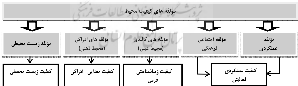
شکل ۱- عوامل مؤثر بر کیفیت محیط (نگارندگان)

با بررسی و مطالعه مفاهیم و تعاریف کیفیت محیط که در جدول ۱ بدان اشاره شد، همچنین با استناد به مؤلفه‌های سه‌گانه کیفیت محیط از دیدگاه گلکار(۱۳۷۹) که شامل «کیفیت عملکردی»، «کیفیت زیباشناختی- تجربی» و «کیفیت زیست‌محیطی» هست، می‌توان مؤلفه‌های اثرگذار بر ارتقاء کیفیت محیط را در یک جمع‌بندی کلی به‌صورت زیر بیان نمود: