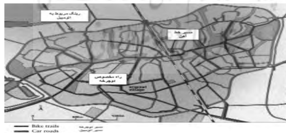
تصویر ۱: طرح شهر هوتن (Houten) در هلند (طرح پروانه ای)

شهرهای اقماری، به شکل جوامعی در ارتباط با نواحی مادرشهری که پیوند و عملکرد مستحکم و اساسی با شهر مرکزی برقرار می‌کنند طراحی شده‌اند. مواصلات و ارتباطات مناسب (با مادرشهر) امری ضروری است و زمان جابه‌جایی و مسافرت روزمره به مرکز شهر نباید از ۳۰ تا ۴۰ دقیقه فزونی یابد (Lum and Hu, 2004). با توجه به مطلب ذکر شده، در زمینه حمل نقل شهرهای جدید آنچه حائز اهمیت است سرعت و فاصله زمانی طی شده تا مادر شهر است که نوع وسیله نقلیه در این زمینه تعیین‌کننده است. تجربه اکثر شهرهای جدید در سراسر دنیا متکی بر حمل و نقل ریلی است. نمونه بارز این تجربه در مورد شهرهای بریتانیاست. یا به عنوان نمونه‌ای دیگر یکی از دلایل موفقیت پنج شهر جدید ساخته شده در اطراف شهر سئول، ارتباط آنها به مرکز شهر بوسیله مترو است (معصوم، ۱۳۸۰). علاوه بر توجه به ارتباط مناسب میان شهر جدید و مادرشهر نباید نسبت به سلسله مراتب دسترسی در سطح شهر جدید و محلات بی‌توجه بود، شهر جدید هوتن ۵ در هلند در فرم فشرده پروانه‌ای شکل (شکل شماره ۱) طراحی شده که دو نوع قابلیت حرکت در تصویر نشان داده شده است. جابه‌جایی با اتومبیل منوط به مسیر خارجی و رینگ است (که شهر را محصور کرده است). بیشتر مسیر حرکت در شهر بر مبنای حرکت پیاده و دوچرخه انجام شده است (Beatley, 2000).