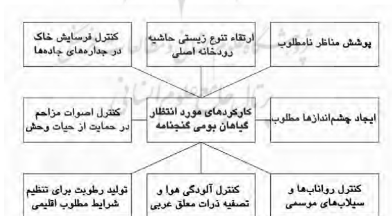
تصویر ۴. کارکردهای مورد انتظار از پوشش گیاهی بومی انتخاب شده بر اساس نیازسنجی‌های صورت گرفته.