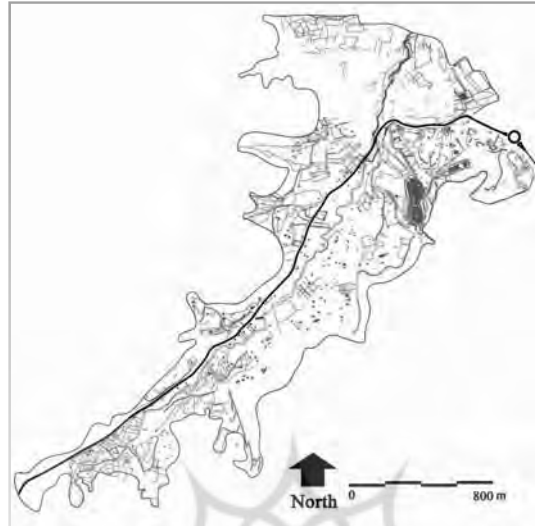
تصویر ۱. موقعیت محدوده مورد مطالعه. خطوط محدود کننده بر اساس نقشه طرح تفصیلی شهر همدان (۱۳۸۵) ترسیم شده است.

تمایل عمومی به استفاده این دره به عنوان مقصد گردشگری، توانش زیستی منطقه ۷ ، با مخاطرات دیگری نظیر آلودگی آب‌ها، آلودگی هوا، خاک، تضعیف جوامع گیاهی و جانوری و مواردی از این دست روبرو است. بنابراین، نیاز به انجام مطالعات به منظور فراهم سازی زیرساخت‌های مناسب برای توسعه پایدار منظر ۸ در محدوده مورد مطالعه امری ضروری و غیرقابل اجتناب به نظر می‌رسد (تصویر ۱ و ۲).