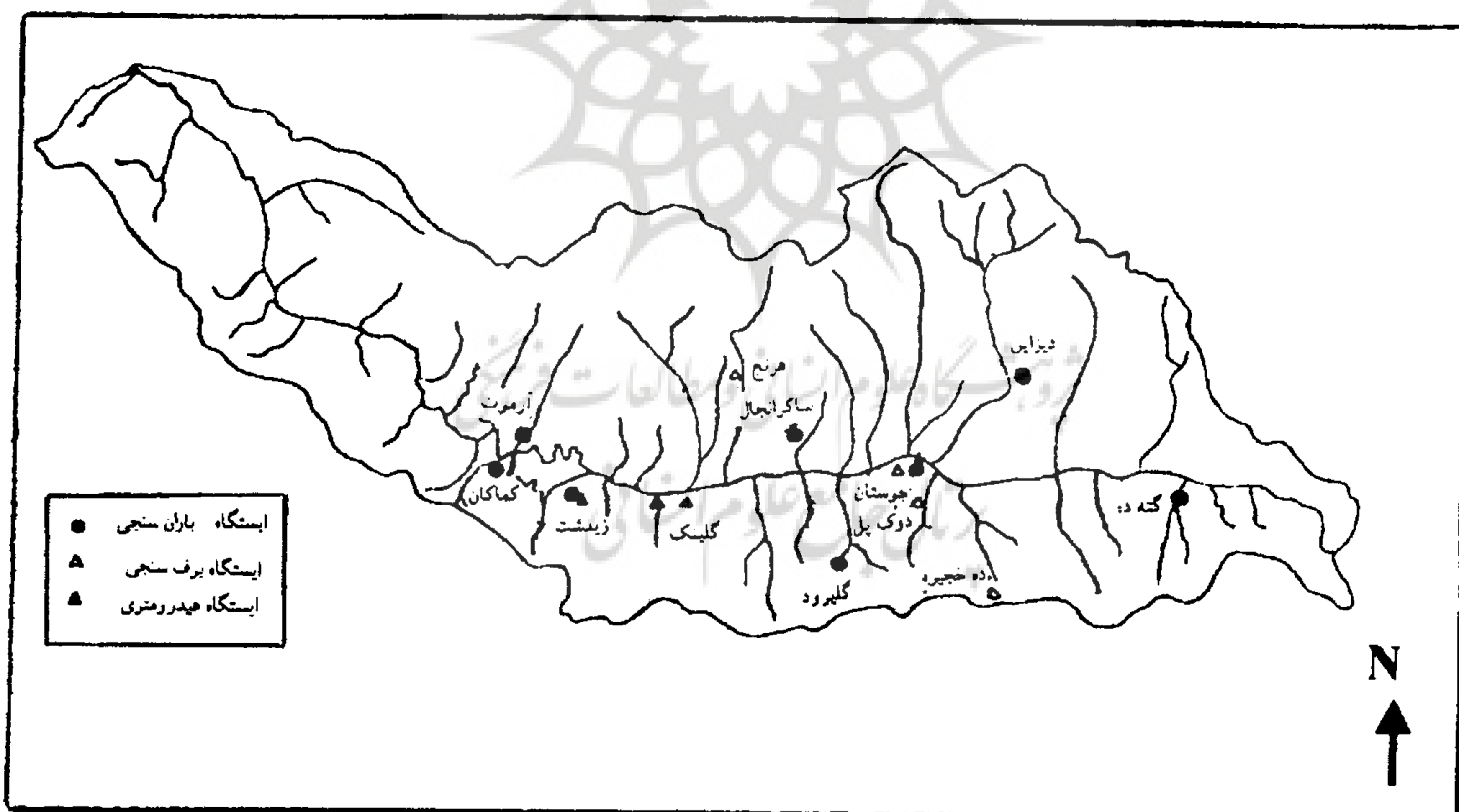
شکل ۲- موقعیت ایستگاههای باران سنجی و برف سنجی و هیدرومتری حوضه آبریز طالقان

موقعیت ایستگاههای مختلف واقع در منطقه مطالعاتی در شکل شماره (۲) آمده است.