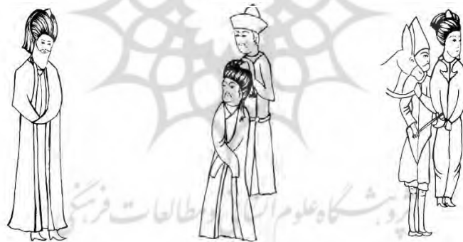
الف) پوشاک جوانان (A) Clothes of youth ب) پوشاک میان‌سالان (B) Clothes of middle-aged ج) پوشاک کهن‌سالان (C) Clothes of the elderly

رنگ طرح‌دارش دیده می‌شود و شلوار کوتاهی که تا زانو است، بر تن دارد. اغلب جوانان کفش‌های با رویه کوتاه به پا دارند (تصویر ۹ - الف). (ب) میان‌سالان: بعضی از فیگورهای میان‌سال عمامه و بعضی کلاه نمدی مخروطی بر سر دارند. جامه دو مرد جلوی تصویر، قبایی به رنگ نارنجی و آبی است که جلو باز و به صورت اریب در زیر بغل بسته شده است، جبه یا بالاپوشی به رنگ بنفش روشن و مشکی به تن دارند که یکی حاشیه سرتاسری پوست دارد و دیگری تزیینات بسیاری دور یقه تا سرشانه، آستین، دور میچ و حاشیه پایین دامن که طلایی‌رنگ است؛ و آستین‌های آن انگشتان دست را پوشانده است. فیگورها چکمه‌های ساق بلند و نوک‌تیز به پا دارند (تصویر ۹ - ب). (ج) کهن‌سالان: سرپوش کهن‌سالان عمامه است. جامه مرد کهن‌سال، پیراهن بلندی با یقه هفت و به رنگ قهوه‌ای و جلو باز است که با دکمه بسته می‌شود؛ و جبه یا بالاپوشی به رنگ قهوه‌ای که حاشیه پوست سرتاسری دارد و آستین بلندی که انگشتان دست را پوشانده است. پیکره‌های کهن‌سال، چکمه‌های ساق بلند و نوک‌تیز به پا دارند (تصویر ۹ - ج).