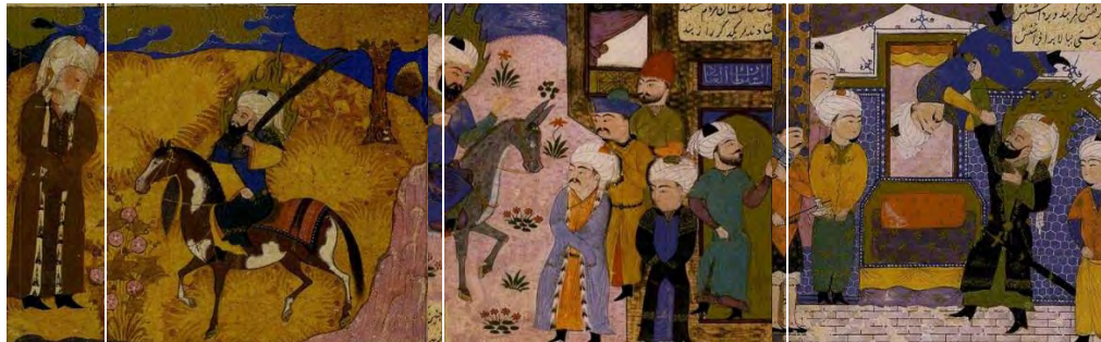
الف) جوانان: نبرد امیر (ع) در دربار شاه طهماسب ب) میان سالان: نگاره رهایی بندیان ج) کهن سالان: حضرت امیر (ع) در جستجوی دلدل A) The youth: The battle of Amir (AS) in the court of Shah Tahmasb B) The middle-aged: Liberation of the prisoners C) The elders: Hazrat Amir in search of the Doldol