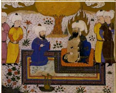
ب) پهلوانان: مهتران سپاه در محضر حضرت امیر (ع)

B) The heroes: Amirs of the army in the presence of Hazrat Ali