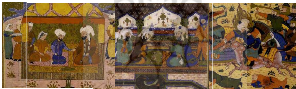
الف) وجه حماسی: مبارزه حضرت علی (ع) ب) وجه مذهبی: یاران حضرت رسول در مسجد ج) وجه عاشقانه: مجلس عقد در حضور حضرت A) The epic genre: The struggle of Hazrat Ali B) The religious genre: The companions of the Prophet in the mosque C) The romance genre: A scene of marriage in the presence of the Hazrat

تصویر ۳: منتخب جامعه آماری: گروه وجوه ادبی