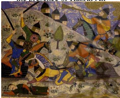
د) سپاهیان: شکست سپاهیان شاه مغرب

A) The important religious figures: The coming of the Prophet Khidr to help Amir al-Mu'minin