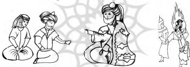
الف) وجه حماسی (A) Epic genre ب) وجه مذهبی (B) Religious genre ج) وجه عاشقانه (C) Romance genre

صورت را گرفته است. تن پوش پیامبر (ص) ، پیراهنی به رنگ قهوه‌ای تیره بلند با آستین‌های گشاد و بلندی است که تا مچ دست می‌رسد؛ همراه با قبای به رنگ سبز خاکستری، جلو باز و با آستین‌های گشاد و بلند و بالا پوشی به رنگ آبی لاجوردی است که دارای تزیینات فراوانی است و حضرت دستمال سفیدرنگی در دست دارند. به دلیل نشسته بودن فیگور پا پوش دیده نمی‌شود (تصویر ۸-ب). (ج) وجه عاشقانه: سرپوش مردان عمامه است و سرپوش بانوان روسری توری شکل که با مروارید در زیرگلو بسته شده همراه با دستمالی که دور سر بسته شده و دنباله آن پشت سر آویزان است. عروس و داماد جامه‌شان پیراهنی به رنگ زرد و بنفش روشن است، قبای جلو باز به رنگ نارنجی و آبی بنفش که با دکمه بسته شده، با آستین کوتاه مصور شده است؛ جامه داماد تزییناتی در دور یقه و سرشانه و حاشیه‌ای سرتاسر آن دیده می‌شود، کمر بندی هم به کمر بسته است. پا پوش‌ها جوراب سفیدرنگ است (تصویر ۸-ج).