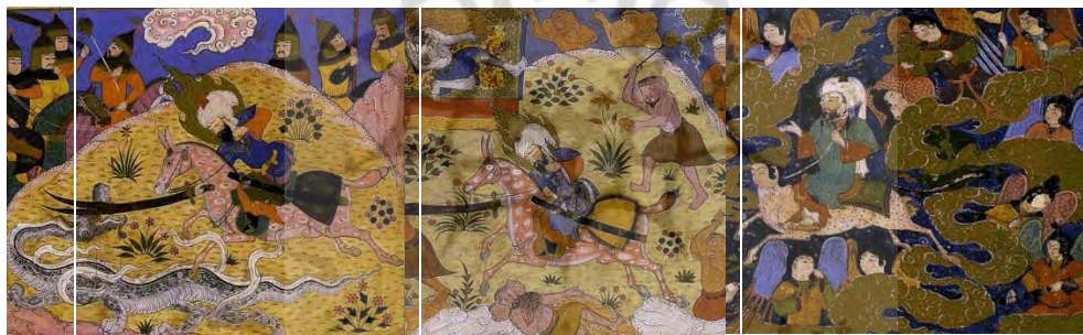
الف) فرشتگان: معراج حضرت رسول ب) دیوان: حضرت امیر (ع) در نبرد با موجودات ج) اژدها: حضرت امیر در نبرد با اژدها A) The angels: Ascension of the Prophet B) The devil: Amir in the war with the wonders of creatures C) The dragon: Amir in the battle with the dragon

تصویر ۵: منتخب جامعه آماری: گروه موجودات فرازمینی