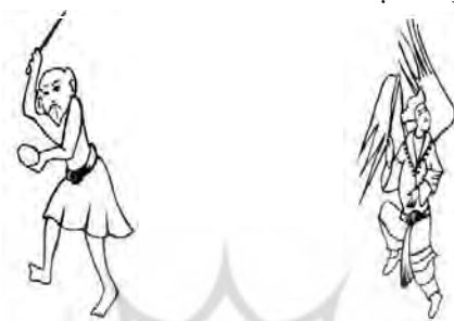
الف) پوشاک فرشتگان (ب) پوشاک دیوان A) Clothes of angels B) Clothes of devils تصویر ۱۰: نوع پوشاک در گروه موجودات فرازمینی (نگارندگان)

جبه‌ای به رنگ گلبهی با یقه برگردان به رنگ آبی طرح‌دار، آستین‌های کوتاه و تزییناتی دور یقه، در حاشیه دامن و شالی بلند که دور کمر بسته و دنباله‌های آن آویزان است و شلوار گشاد قهوه‌ای‌رنگ و جوراب حریر به پا دارند (تصویر ۱۰- الف). (ب) دیوان: این گروه، فاقد سرپوش و تن‌پوش‌اند. فقط دامنی کوتاهی تا زانو که با کمربندی بسته شده است، بر تن دارند (تصویر ۱۰- ب).