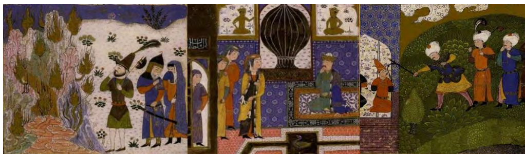
الف) مردان: عمرو امیه و سایر عیاران ب) زنان: دختر جمشیدشاه و ندیمه‌ها ج) زنان و مردان: عمرو امیه و صلصال در برابر آتش A) The men: Amr Umayyah and other nobles B) The women: daughter of Jamshid Shah and maids C) Both men and women: Amr Umayyah and Salsal against fire