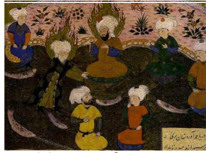
الف) بزرگان دینی: در آمدن خضر نبی (ص) به یاری امیرالمومنین (ع)

B) The heroes: Amirs of the army in the presence of Hazrat Ali