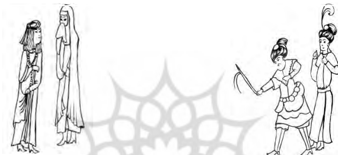
الف) پوشاک مردان ب) پوشاک زنان A) Clothing of the men B) Clothing of the women

می‌شود که دستمالی را جلوی دهان خود گرفته است. در نگاره دختر جمشیدشاه، جامه بانوان پیراهنی به رنگ نارنجی است که قد آن تا قوزک پاست و قبایی به رنگ قهوه‌ای تیره که جلو باز است و به وسیله دکمه‌های طلایی بسته شده و تزییناتی طلایی رنگ بر روی دامن لباس تعبیه شده است. زنان دارای آستین‌های تنگ که بلندی آن تا مچ دست است و بعضی با آستین کوتاه به تصویر کشیده شده‌اند. جبه یا بالاپوشی به رنگ زرد و با تزیینات طلایی رنگ که با آستین‌های بلند و دارای حاشیه سرتاسر پوست است و چکمه‌های ساق بلند و نوک تیز دارند (تصویر ۷-ب).