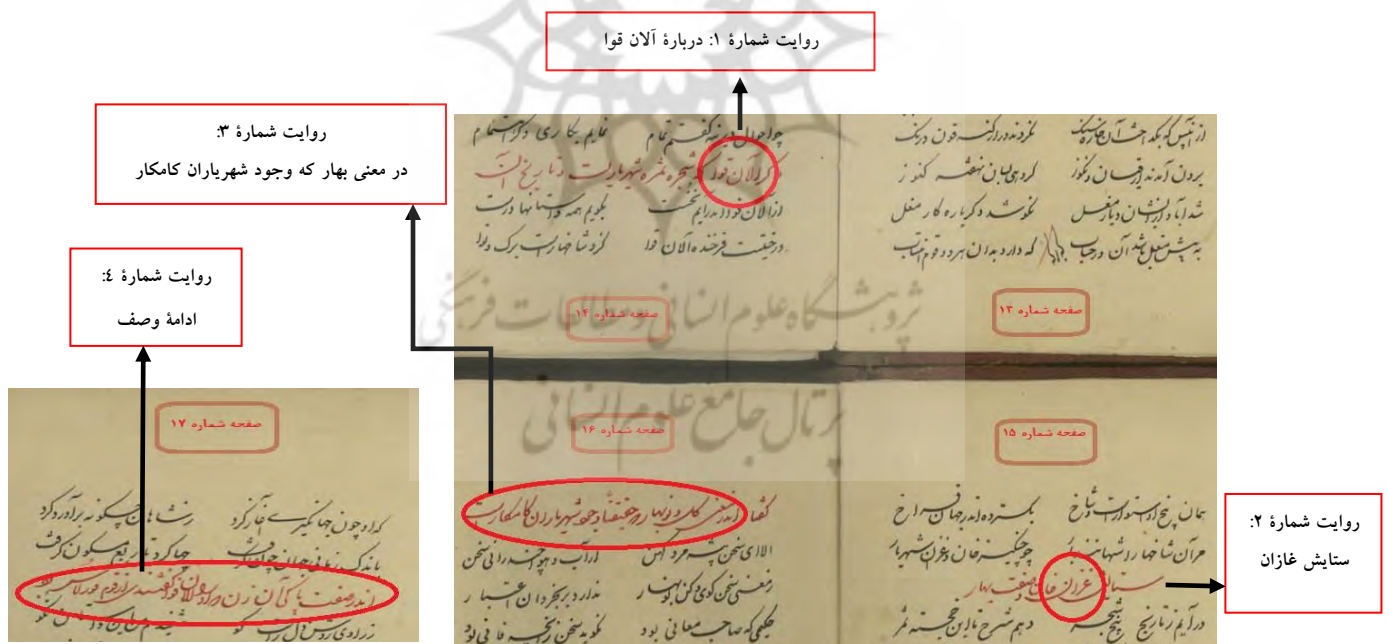
تصویر شماره ۳: رعایت نکردن ترتیب تاریخی در روایت داستان‌های نسخه‌ی شهنامه‌ی چنگیزی (همان: ۱۴-۱۷)