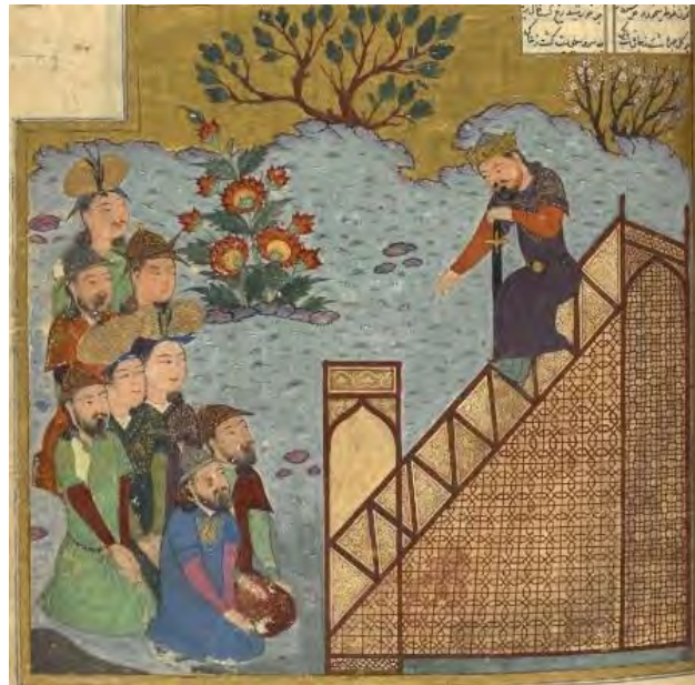
تصویر شماره ۱: نگاره و عطا گفتن چنگیز خان در مسجد بخارا (همان: f 61r)

شهنامه چنگیزی نیز خواست الهی برای انتقام خون بی‌گناهان و تسخیر حکومت را دلیل حمله به ایران و پیروزی چنگیز روایت کرده است: