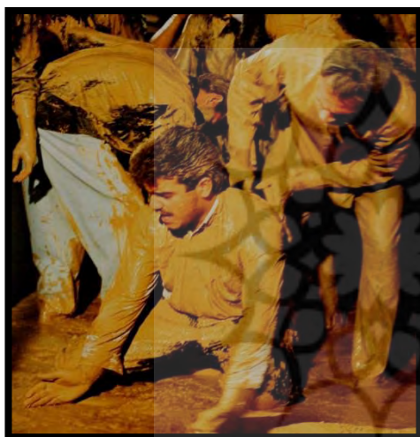
تصویر ۱. همیاری در خرّه‌مالی

در حال حاضر، در گفتار عامه، «خاک بر سر شدن»، در مقام بدبخت شدن و «خاک بر سر» در مقام تحقیر و بی‌نوایی، به فراوانی مورد استفاده قرار می‌گیرد. عمل خاک بر سر ریختن، هنگام مصیبت، در جوامع روستایی و شهری به چشم می‌آید. امروزه، در سطح کشور و حتی در تهران و کرج، برخی از بازماندگان درجه اول فرد در گذشته، هنگام خاک‌سپاری عزیزشان، از خاک گور بر سر می‌ریزند، حتی گاه نیز دیگران بر ایشان چنین کاری می‌کنند چون باور بر این است که با ریختن خاک بر سر صاحبان عزا، آنان آرام‌تر و صبورتر می‌شوند.