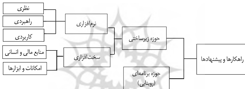
انگاره ۱: مدل مبنایی تحلیل پیشنهادها و راهکارهای نخبگان

به منظور تحلیل پیشنهادها و راهکارهای نخبگان برای هجرت طلاب، مدل زیر مبنا قرار گرفته است.