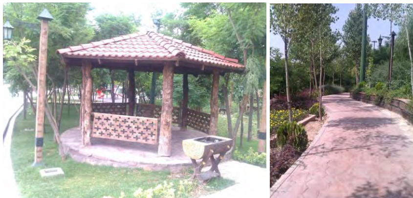
شکل ۴. مسیرهای طولی (سمت راست) و آلاچیق‌های محصور (سمت چپ)