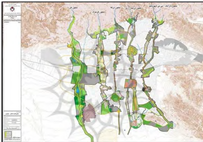
شکل ۲. پنج محور مسیل‌های شهر تهران

توجه جدی است. مسیل رود درکه از شمال به دره درکه در کوهپایه البرز و از جنوب به میدان میوه و تره بار شهر در مجاورت کمربندی آزادگان می‌رسد و از آنجا به سمت بهشت زهرا ادامه می‌یابد. براساس طرح تفصیلی شهر تهران (۱۳۸۹) رود دره اوین درکه جزء زیرپهنه‌های اصلی سبز و باز است. این پهنه مساحتی حدود ۲۱,۲۳,۶۵۹ مترمربع دارد. ضریب سکونت، صفر درصد و تعداد واحد مسکونی در آن نیز صفر است. برای این پهنه در طرح تفصیلی کاربری پارک فضای سبز در نظر گرفته شده است.