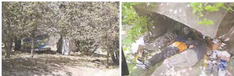
شکل ۳. جنگل ۱۸ هکتاری و تجمع افراد بی‌خانمان

به همین دلیل فضای ناامنی در این منطقه ایجاد شده بود. به علاوه از نظر زیست‌محیطی و زیبایی محیط مناسبی محسوب نمی‌شد و چشم انداز مناسبی نداشت. به همین دلیل شهرداری منطقه ۲ تصمیم گرفت در این منطقه یک پارک احداث کند. مشکلات وضعیت پیش از اقدام مداخله‌ای را می‌توان به چند دسته تقسیم کرد: