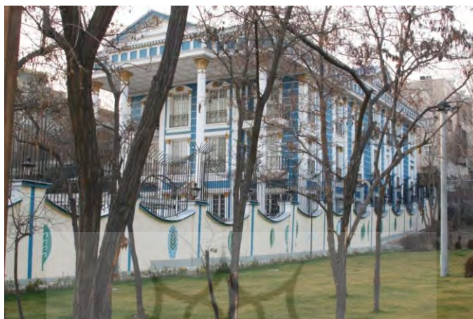
شکل ۵. منظره یکی از خانه‌های مشرف به پارک

خیابان‌های شهرک غرب است و بسیاری از خانه‌های ویلایی و گران‌قیمت در این خیابان قرار دارند. شهرک غرب نیز یکی از قسمت‌های گران‌قیمت شهر تهران است (شکل ۵).