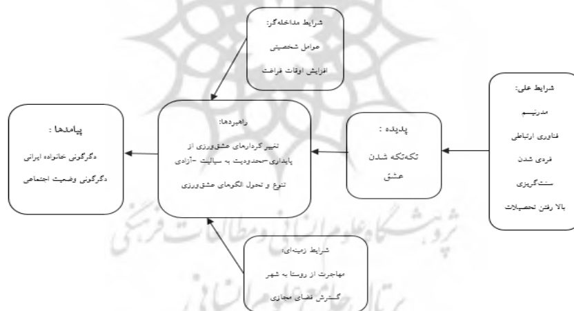
شکل ۴. نظریه برپایه درباره تحول الگوهای عشق‌ورزی

۵. پیامدها و نتایج: تغییر اساسی در وضعیت اجتماعی ایران رخ داد. براساس شرایط تاریخی تغییر در کردارهای عشق‌ورزی و تحول در الگوهای عشق‌ورزی، دو نوع پیامد را به دنبال داشت: دگرگونی در خانواده ایرانی و دگرگونی در وضعیت اجتماعی (شکل‌گیری‌های انواع جدیدی از روابط میان افراد).