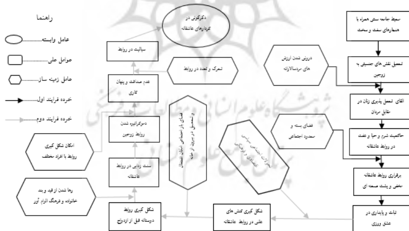
شکل ۱. فرایند دگرگونی کردارهای عاشقانه

با دگرگونی‌های اجتماعی، سیاسی، اقتصادی و فرهنگی جامعه، همراه با مهاجرت از روستا به شهر، شاهد تغییر در رفتارهای پایدار و باثبات عشق‌ورزی به صورت رفتارهای سیال هستیم. شکل‌گیری کنش‌های متقابل علنی و فعالانه در روابط، با بازشدن فضای اجتماعی و امکان اشتغال و تحصیل در بیرون، به شکل‌گیری روابط دوستانه پیش ازدواج و پذیرش این موضوع از سوی خانواده‌ها و بزرگ‌ترها می‌انجامد؛ از این رو افراد جوان‌تر در کردارهای عاشقانه خود سنت‌زدایی می‌کنند. آن‌ها از قید و بند خانواده و فرهنگ الزام‌آور رها می‌شوند و به کردارهای عاشقانه آزادتری دست می‌یابند. سنت‌زدایی، دموکراتیزه‌شدن روابط زوجین را به دنبال دارد و اگر با امکان شکل‌گیری روابط با افراد مختلف همراه شود، می‌تواند سبب پنهان‌کاری و از بین رفتن صداقت شود. اگر این دو عامل با تحرک و تعدد در روابط همراه شود، ساختارهای روابط زوجین را می‌شکند و فراتر از چارچوب زندگی زناشویی می‌رود. متعددشدن روابط با همکاران، سبب تفننی و گذراشدن روابط سیالیت می‌شود. براین اساس فرایند دگرگونی از ثبات در کردارهای عاشقانه تا بی‌ثباتی و سیالیت در رفتارهای عاشقانه شکل می‌گیرد.