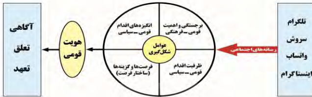
شکل ۱. الگوی نظری پژوهش