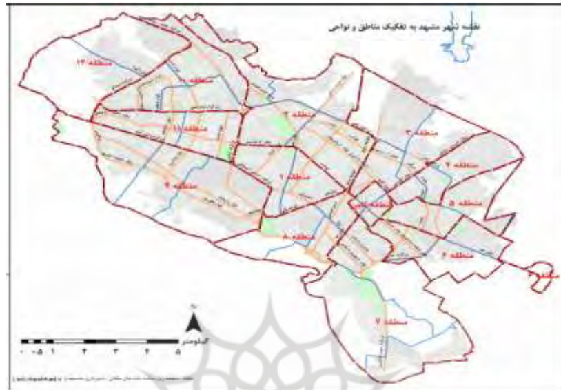
شکل ۱- نقشه مناطق شهر مشهد