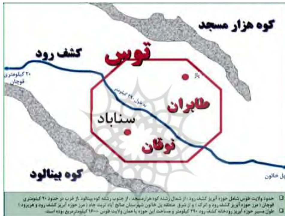
شکل ۱- حوزه جغرافیای تاریخی-فرهنگی توس (خطه توس-حوزه آبریز کشف‌رود)

شاعران پارسی، فرهنگ اصیل پهلوانی و ورزش‌های باستانی جاری در منطقه نظیر کشتی و ...، موقعیت بسیار ممتاز و مناسبی دارد (سند راهبردی باززنده‌سازی توس، ۱۳۹۶).