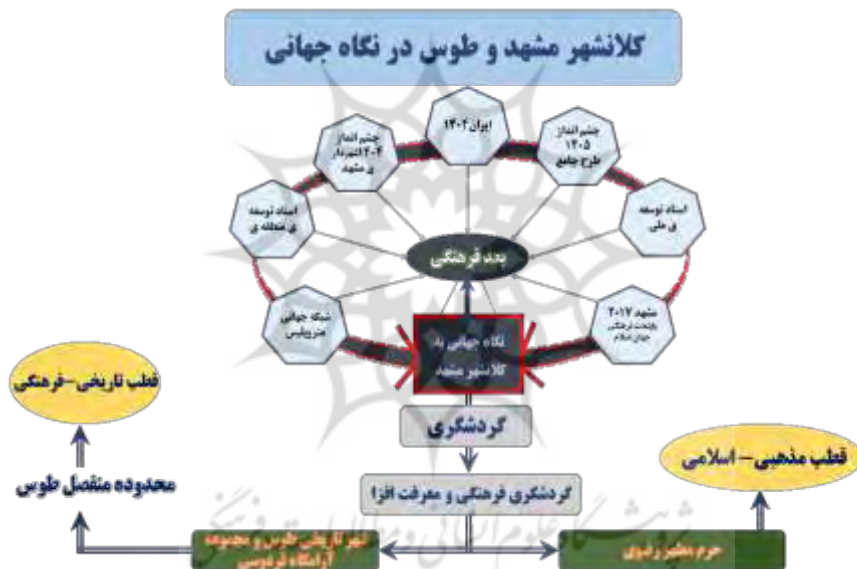
شکل ۲- جایگاه شهر مشهد و توس در اسناد فرادست و نگاه جهانی (سند راهبردی باززنده‌سازی توس، غزنوی، ص. ۱۳۹۶)

تمرکز بر توسعه گردشگری با تأکید بر ابعاد فرهنگی این بستر عظیم راهی برای بازگرداندن شکوه منطقه و انتفاع آن از مواهب اقتصادی، اجتماعی و فرهنگی گردشگری خواهد بود که نیازمند تدابیر مدیریتی مناسب در تمامی حوزه‌های اجتماعی فرهنگی، اقتصادی سیاسی و زیست‌محیطی در راستای دستیابی به توسعه است.